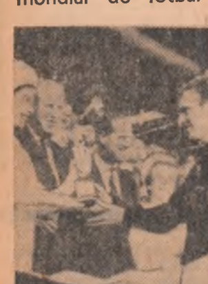
Capitanul echipei Angliei, Bobby Moore, primește multă atenție la Jules Rimet.

● În urma unei anchete realizată în rîndul specialiștilor prezenți la Londra a fost alcătuită în sistemul 1-4-3-3, următoarea echipă a campionatului mondial: Banks (Anglia) — D. Santos (Brazilia), Schulz (R.F.G.), Bobby Moore (Anglia), Marzolini (Argentina) — Beckenbauer (R.F.G.), Bobby Charlton (Anglia), Voronin (U.R.S.S.) — Bene (Ungaria), Eusebio (Portugalia), Simoes (Portugalia).