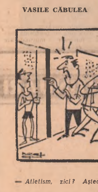
— Atletism, zici? Așteaptă, nu vezi că avem oaspele de seamă? Desen de NEAGU RĂDULESCU