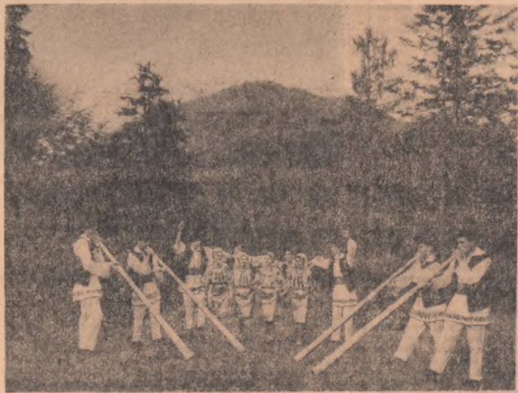
SINAIA. Spectacol în aer liber prezentat de formația artistică din Stoicănești, Argeș

În această săptămîna comentariile noastre se referă la evoluția relațiilor din interiorul N.A.T.O., precum și la noile măsuri economice ale guvernului britanic.