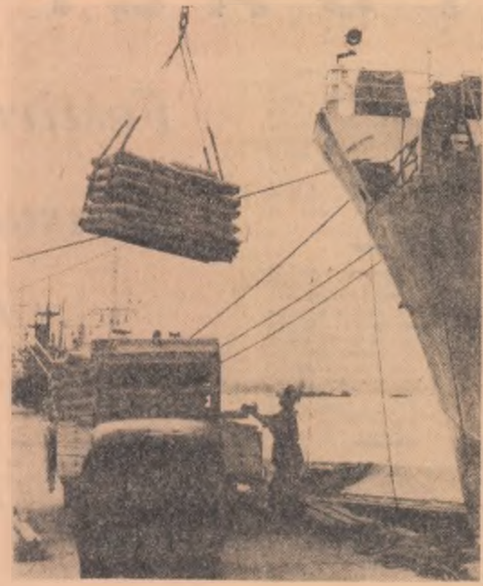
In ciuda atacurilor pirateresti ale aviației americane, activitatea în portul Haifong se desfășoară cu intensitate