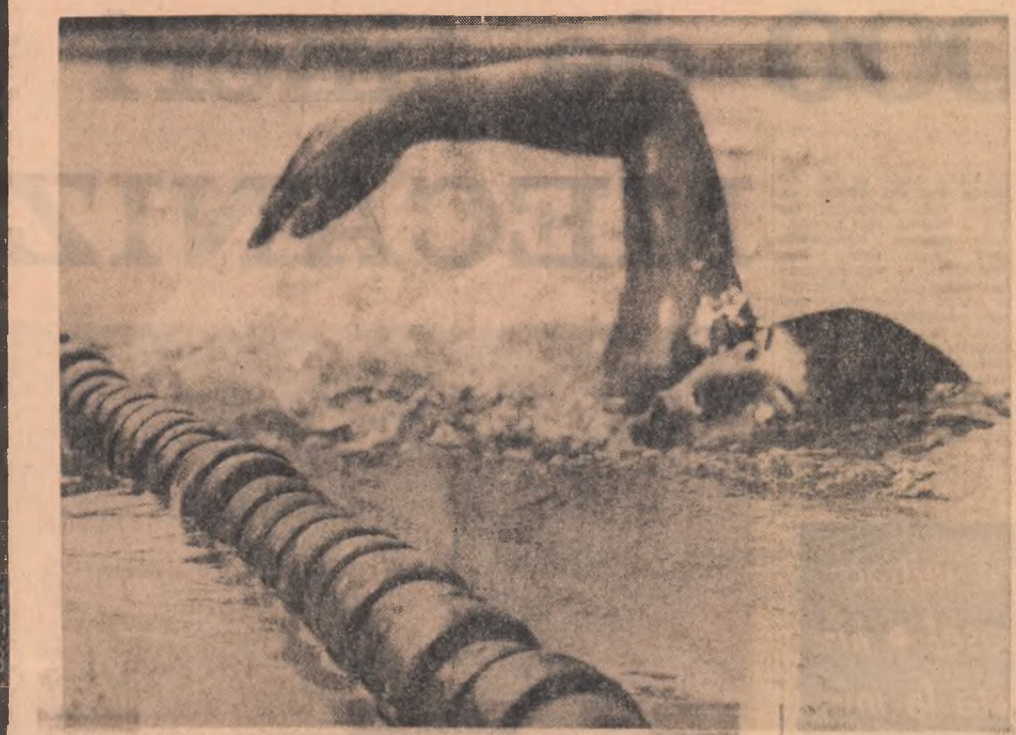
Doar cîțiva metri mai sînt din acest finis: irezistibil și abilității vor înregistra un nou record republican la natație