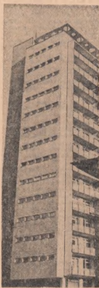
R. P. POLONĂ. — Din noul peisaj varșovian