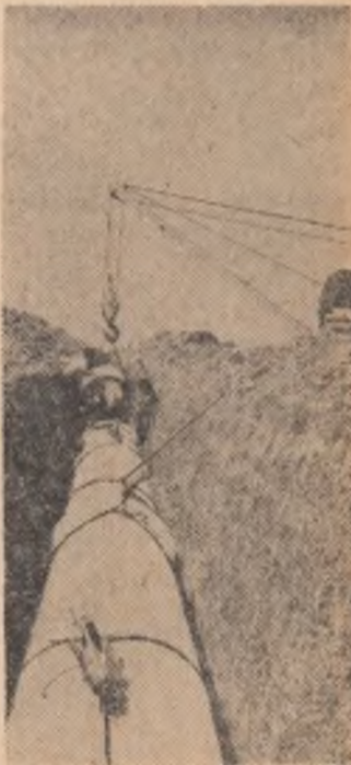
Șantier de irigații la G.A.S. „30 Decembrie” din regiunea București. Încă 2 100 hectare vor primi ploaie artificială în anul viitor

S-a luat legătura cu teatrele din provincie, care s-au oferit să dea spectacole în București, dar dificultățile de programare au fost — se pare — insurmontabile. Se adaugă la toate acestea iremediabila ploaie, care umple teatrele de băltoace și băltoacele