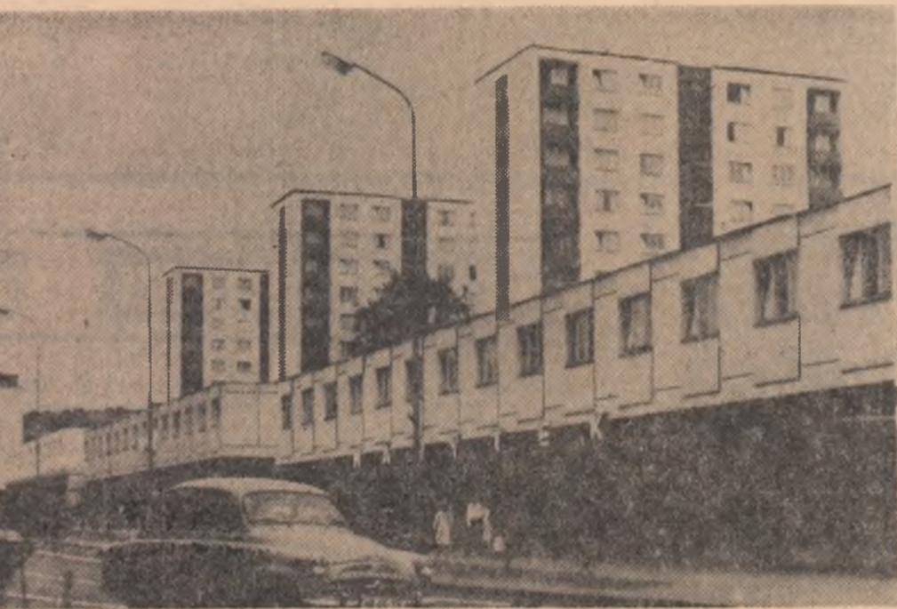
CEHOSLOVACIA. — Aparatul fotografic surprinde o imagine din orașul Mlada Boleslav

Autoritățile consideră că este vorba de o crimă a unui dezzechilibrat mintal. În aceeași zi, Whitman și-a asasinat în apartamentele lor soția și mama. Guvernatorul statului Texas, John Connally, care se află la Rio de Janeiro, a declarat că a ordonat deschiderea „unei anchete amănunțite” în legătură cu acest caz. El a recunoscut că incidentul de luni în-țre-dus în memorie „amintiri nepăcute” în legătură cu asasinarea președintelui Kennedy, la 22 noiembrie 1963, în capitala statului Texas, Dallas, care se află la 288 km distanță de Austin.