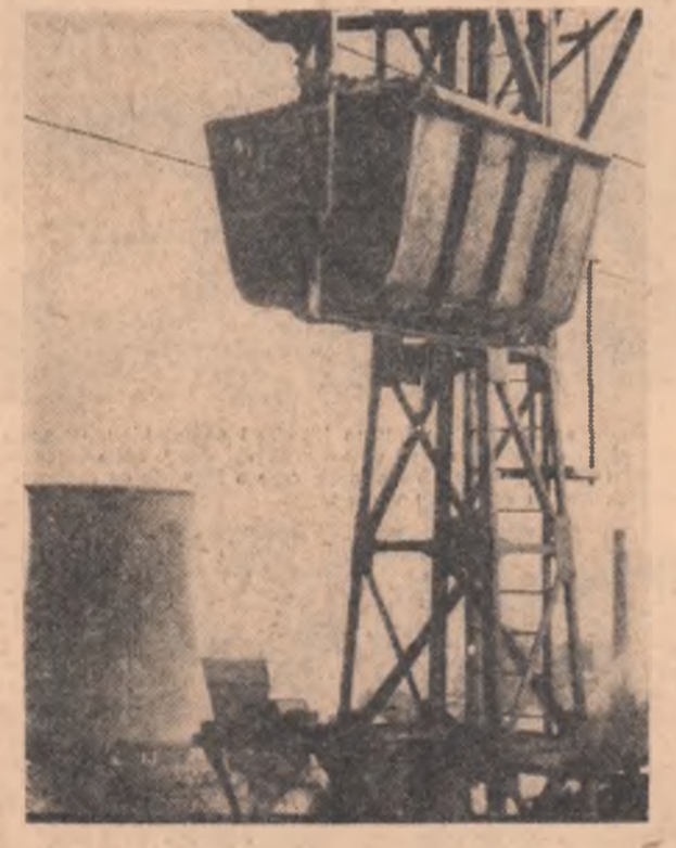
Reșița. Transport de minereu

ANUL XXII, SERIA II, NR. 5355 6 PAGINI - 25 BANI SÎMBĂȚĂ 6 AUGUST 1966