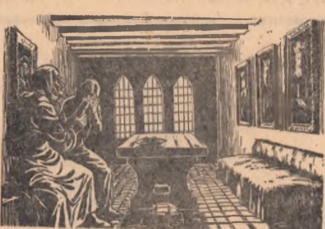
Un personaj din romanul 'Frății Jderi' de Mihail Sadoveanu.

Rezumat. Datorită vicisugului moșei Irina Vorniceasa, Nicolăies s-a aprit cu prada lui la Volcineț. Acest tirgusor e dat acum de Cazimir-Crai, lui Mihai Logofăt, boier moldovean fugat în Țara Lezească.