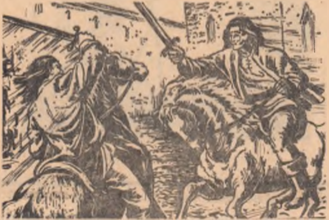
Un alt personaj din romanul 'Frății Jderi'.

— Am dori mai cu seamă noi să știm, întrebă comisar Manole, care ar putea fi răsplătirea unor slujitori cu dreptate, ai mării sale?