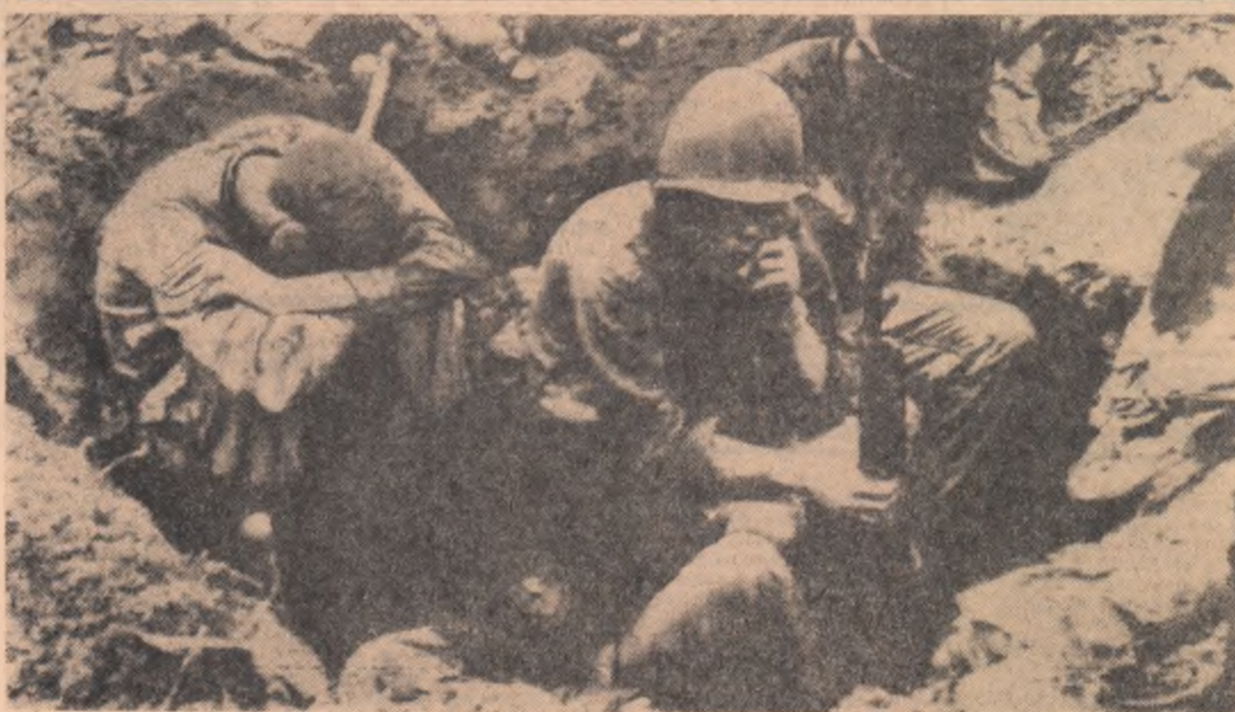
Deprimați și extenuați, acești militari americani, fotografiați nu departe de Plei Me, nu au decît o dorință: să scape de războiul murdar dezlănțuit de S.U.A. în Vietnam

La mijlocul lui Iulie 4000 de membri ai „comisiilor muncitorești” din întreprinderile capitalei spaniole s-au îndreptat spre Ministerul Muncii spre a prezenta un „caz de revendicări”.