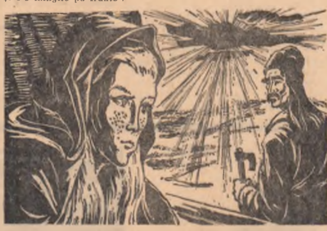
Un alt personaj din romanul 'Frății Jderi'.

— Așa socot și eu. Avem dintru-năun nunta feciorului nostru nequitorului. Aici are amestec mult jupineasa Ilișafa. Este însă altă nuntă la care are cuvînt hotărîr luminăția sa Voda.