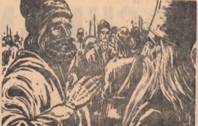
Un alt personaj din romanul 'Frății Jderi'.

— Am dori mai cu seamă noi să știm, întrebă comisar Manole, care ar putea fi răsplătirea unor slujitori cu dreptate, ai mării sale?