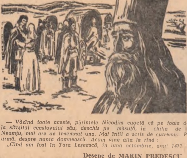
Un alt personaj din romanul 'Frății Jderi'.