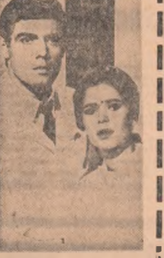
Secvență din filmul „Jurnalul unei femei în alb”

CLEOPATRA — cinematiscop (ambel serie) — rulează la Patria orele 9, 12,45; 16,45; 20,30, București orele 8,30; 12; 16; 19,45; Moderna orele 9,30; 13; 17; 20,45 JURNALUL UNEI FEMEII ÎN ALB rulează la Republica orele 8,45; 11,15; 13,45; 16,15; 18,45; 21,15 Grivița orele 9; 11,15; 13,45; 16; 18,30; 21 ALBA CA ZĂPADĂ ȘI CEI ȘAPTE SĂLTĂMBĂNCI rulează la Republica (în programul viitor) CINELE DIN BASKERVILLE rulează la Luceafărul orele 9; 11,15; 13,30; 16; 18,30; 21 Festival orele 9; 11,15; 13,30; 16; 18,30; 21 Tomis orele 9; 11,15; 13,30; 16,15; 18,30; 20,45 Floarea orele 9; 11,15; 13,30; 16; 18,30; 21 IN NORD, SPRE ALASCA rulează la Festival (în programul viitor) URME ÎN OCEAN rulează la Capital orele 9; 11,15; 13,30; 16; 18,30; 20,45 Melodia orele 9; 11,15; 13,30; 16,15; 18,30; 20,45