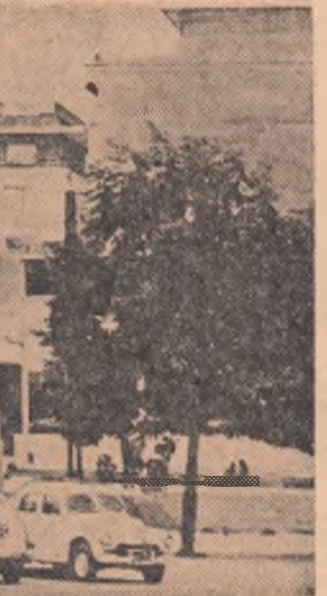
R. P. POLONĂ. — O imagine din Varșovia

Convenția națională a partidului de opoziție „Mișcarea democratică braziliană” (M.D.B.), înfruntată la Rio de Janeiro, a hotărât să nu prezinte candidații la apropiatele alegeri indirecte pentru desemnarea președintelui republicii și a 11 guvernatorilor de state. Partidul a adoptat această hotărâre în semn de protest împotriva introducerii sistemului electoral indirect. În desemnarea președintelui și guvernatorilor, sistemul este asigurat — menționează A.P.P. — victoria candidaților „oficiali”. Alegerile de guvernatori vor avea loc în septembrie, iar cele prezidențiale în octombrie.