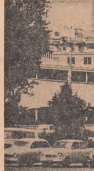
R. P. POLONĂ. — O imagine din Varșovia

ATENA (Agerpres). — Ziarul grec „To Vima” menționează că în interviu tovarășul N. Ceaușescu se exprimă convingerea că vizita în Grecia a delegației române în frunte cu I. Gh. Maurer va contribui la realizarea unor noi progrese pe calea intensificării relațiilor multilaterale dintre România și Grecia.