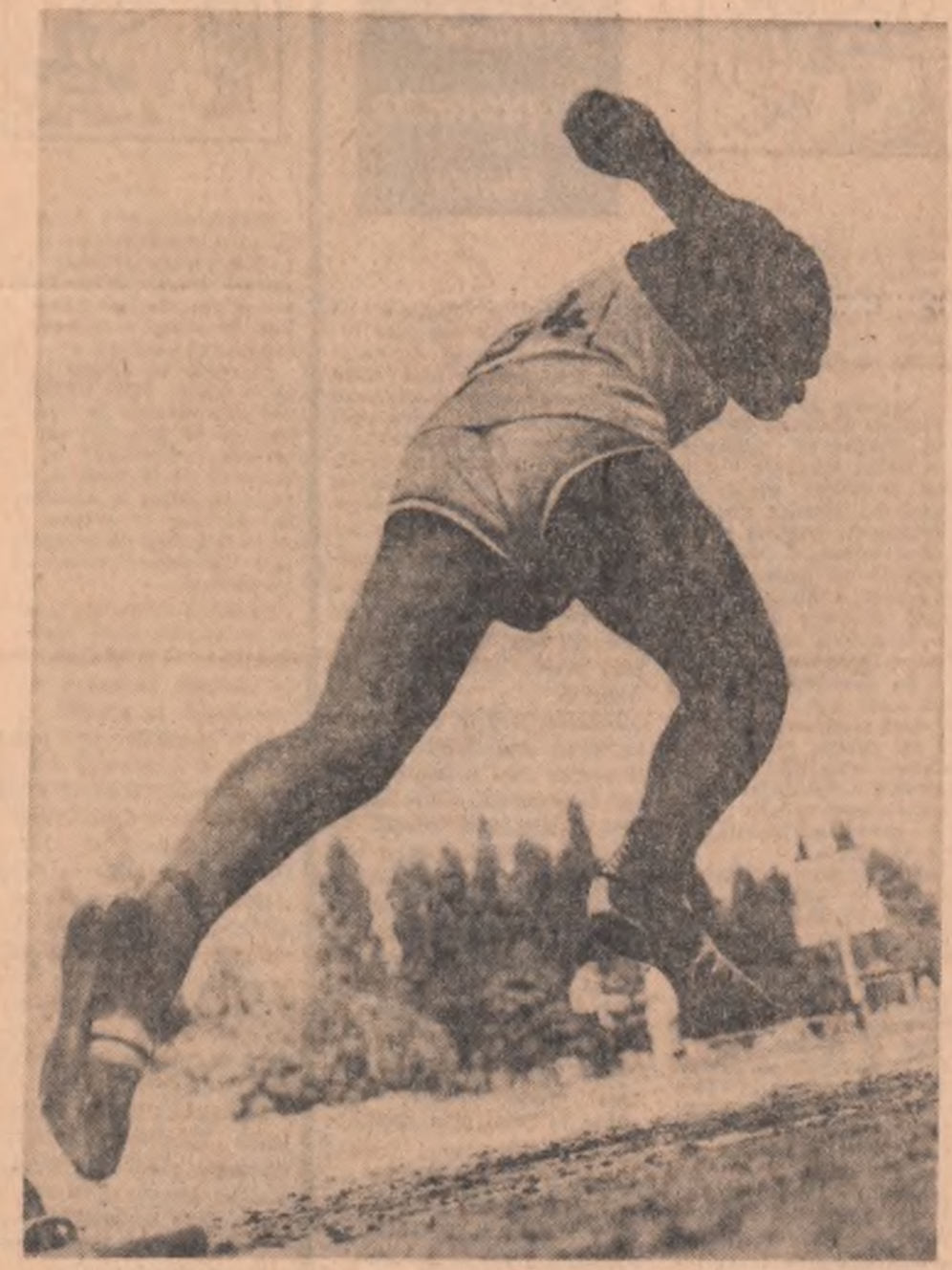
Start în probele atletice ale Spartachiadei