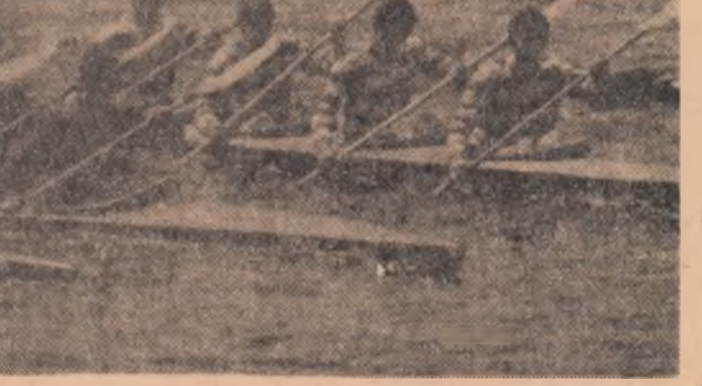
Pe lacul Herăstrău