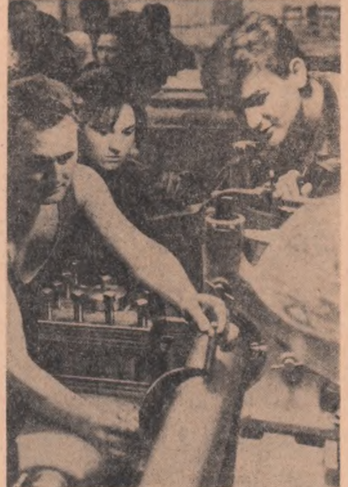
Studentii ai Facultății de Industrie usoară a Institutului politehnic din Iași, în practică la Uzina „Metalotehnică”-Tg. Mureș

Copiii din cartierele „Podgoria” Arad, „Balta Sărata”-Caransebeș și „Gara”-Oravița, unde s-au înălțat blocuri de locuințe, vor învăța în școli noi construite din fondurile statului. Tot în școli noi vor învăța și numeroși copii din Voiteni, Deta, Păulș și din alte comune din regiunea Banat, unde în prezent se află în stadiu de finalizare localurile de învățămînt, ce însumează peste 100 de clase. Alte 64 de săli de clasă se construiesc în diferite comune și sate. Ele vor fi terminate încă înainte de începerea anului școlar. (Agerpres)