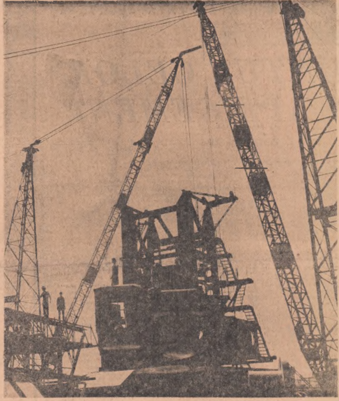
Cu ajutorul acestor macarale gigant se montează utilajele de excavat, nu mai puțin uriașe, pe șantierul Exploatarei miniere din Rovinari