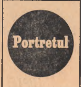
Redactorii de la TIME s-au gîndit să ofere cititorilor un portret al faimosului Verwoerd. Banalul procedeu fotografic (deși utilizat cu dărnicie și în cazul de față) a fost socotit insuficient. Pe șase pagini de revistă, condeiul revistei îl descriu pe premierul de la Pretoria. Șase pagini sînt acoperite cu fraze despre creatorul politicii de apartheid. S-ar fi putut crede că TIME s-a alăturat uriașului cor al celor ce condamnă rînduielele sud-africane. Eroare. Cele șase pagini seamănă cu pledoaria unor nefericiți avocați puși să aperse într-un proces dinainte pierdut. În deficit cu imaginația și puțin plăticiți, autorii de la TIME ni-l înfățișează pe Verwoerd în lumina cel puțin straniu:

a) este „unul din cei mai buni conducători albi pe care Africa i-a produs vreodată”. (În galeria tristelor celebrități a mai rămas loc și pentru Smith...)