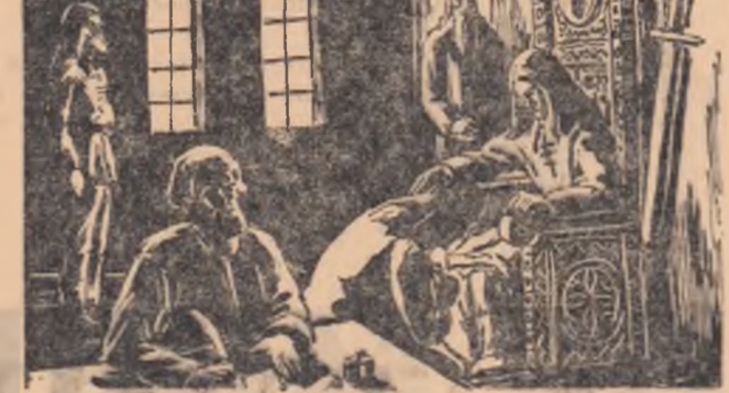
Fîind Maria so mulțumit de vrednicul sau slujitor, poruncește ca Toma Logodit să scrie hrisov — amia de la domnie, lui Onu Făr-Negru, comia, să-i fie ocină lui și urmasilor săi în veștii. Și mai poruncește mîria sa ca Onu Făr-Negru să fie ocina în stăru domnească și să i se încredințeze dăna stăguri de rîzeși.

REZUMAT Ionuț, a săvîrșit bine treburile, în timpul îndepărtatei lui călătorii. După ce a călcat hotarul din Lunca Siretului, unde i-a prins pe cei doi boieri moldoveni fugari în rîmna Brăilei, turcii au spart hotarul dinpre Tara Românească, îndreptîndu-se cu oaste mare spre inima țării, pustiind tot ce li întîlneau în cale.