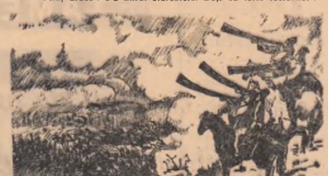
La revărsarea zorilor, s-au umplut văile Birladului ca de un abur de lapie. Era deasă pîclă s-o țui cu călțul. Nu a fost em cără să nu vedă în pîclă care acoperise văile un semn al biruinții. Poizea urdii a pornit din nou prin ceată, ca a unui bălaur cu multe căpe și labe care se țirile prin mîlașină. Cînd a căzut de la domnie poruncește așteptată, suliții și trimbășii de dincoala de lunca Birladului au dat zvonă mare. Pe loc s-a cunoscut că-și înțelepciunea și pînă a celei bălășii. Și Măria sa a repetat altele înjururi.