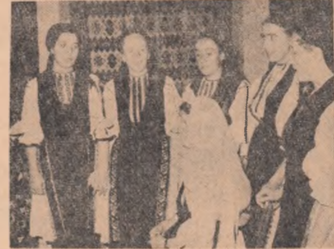
„Cîntecul miresei” din Nunta ciobănească