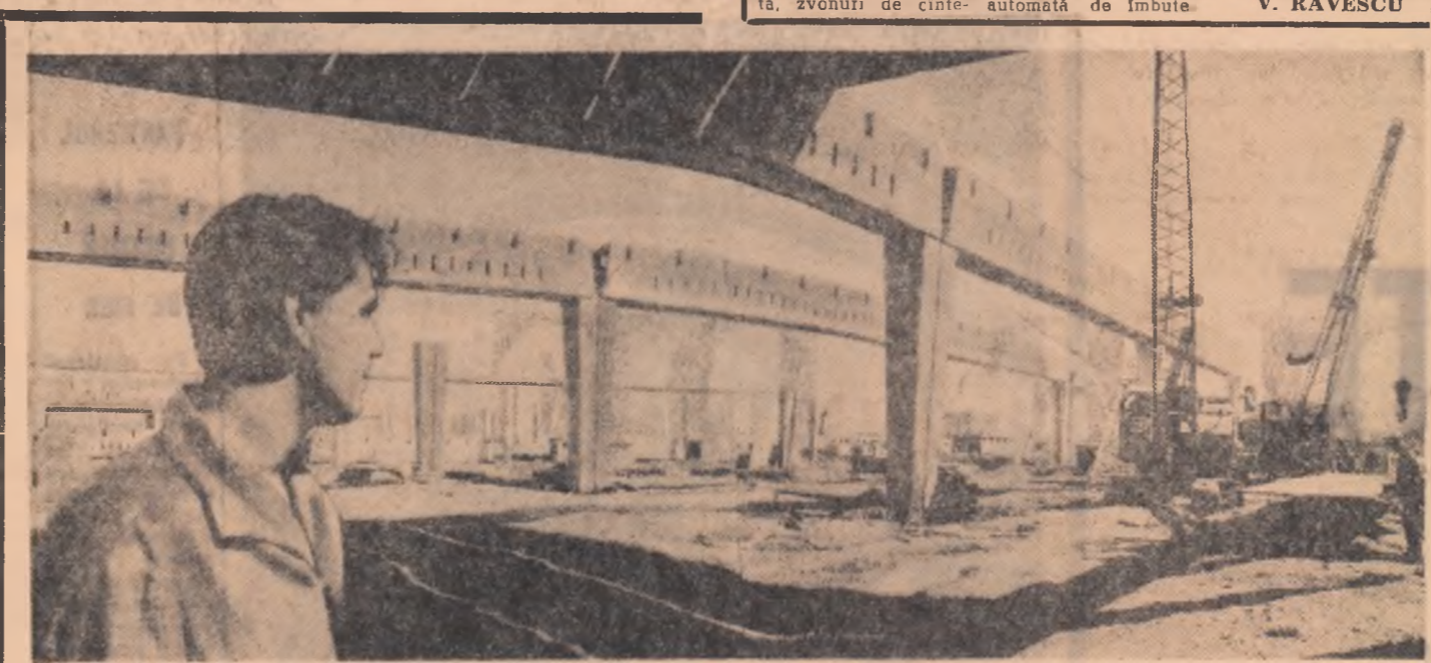
În cartierul „Drumul Taberei” se alină în plină construcție fabrica de tricotate tip Ild. Aici se vor confecționa anual aproximativ 500.000 buccii de tricoteaje.