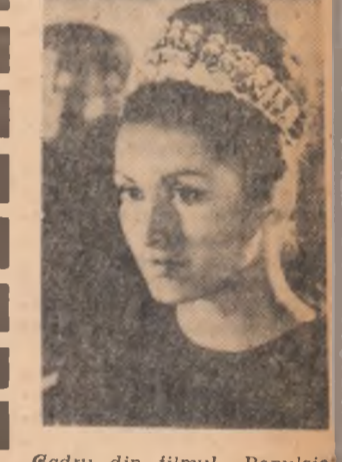
„Cadru din filmul „Repulsie“