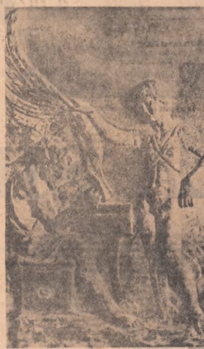
Basorelieful din secolul II î.e.n. Dedal, ajutat de Icar făurindu-și aripi pentru zbor

Și astfel, Roma Românească va cunoaște începând din secolul XIV o bogată activitate de construcție, finalizată în câteva monumente de excepțională valoare arhitecturală și artistică. Ne gândim în primul rând la construcția ridicată în 1353 la Curtea de Argeș. Are dimensiuni mari pentru acele vremi și un plan simplu dreptunghiular. Stilul din incăperile centrale este dispus în așa fel încât să formeze o cruce cu brațe egale, acoperite de bolți cilindrice, ce susține turla centrală. Arhitectura exterioară este de o mare simplitate, dar localul de aceea capătă o deosebită forță expresivă, elementele planului fiind exprimate fidel în volumele clare. Materialul de construcție lăsat aparent și format din fișii de piatră brută, dispuse pe orizontale alternante cu benzi de cărămidă, transformă pereții într-un element viu al cărui rol constructiv și decorativ este perfect exprimat. Ferestrele, puțin largile în secolul XVIII au fost încadrate cu rame de piatră decorate în spirala epocii și care, prin contrast, capătă o valoare mare. Echilibrul maselor arhitecturale, realizat prin linii maxime simetrice și prin interiorul, structura bolților — logică și simplă, discretia elementelor decorative ale cornișei executate din cărămidă dispuse în linii de fierăstrău, turla bine proporționată, conferă monumentului un aspect de armonie elegantă și calmă, aproape unică în vechia noastră arhitectură.