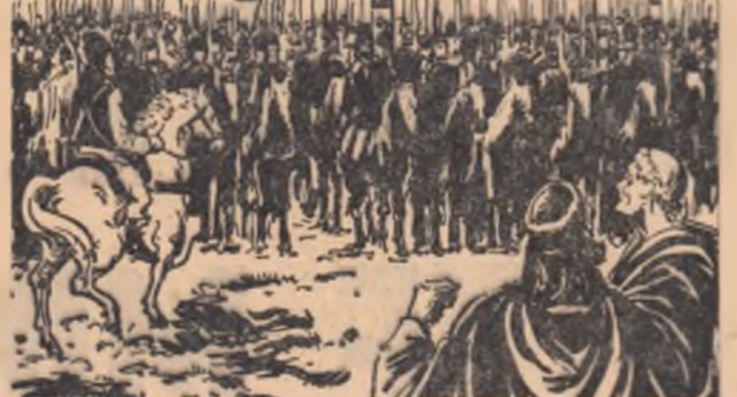
Ca un sîd stau cele două steaguri de răzeși călătoria de Ionuț Păr-Negru. — Ce oșteni sînt aceștia? întrebă curios părintele dominican Geronimo. — Sînt oameni Mării sale, răspunde postelnicul Ștefan. — Oameni Mării sale? Ași dori să cunosc din ce țară i-a ales și i-a născut Măria sa. — Sînt oameni ai pămîntului — a lămurit postelnicul. Pe lingă curtea Mării sale, cu multe mil de slujitori în leată, se adăuga de bună-voie și aceștii oameni de țară. — Et călătore usor, după rînduiala veche a scoltilor, despre care vorbește și Herodot... își face socoteală părintele dominican Geronimo della Rovera, nepotul papei Sixt. Aceștia au biruit pe Darius, Riga persienilor.