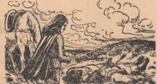
Măria sa a descălecat și a cunoscut în cîțiva pasi, pe cîștigătorii săi, Manole și Iuț sau Șimon, iar mai încolo pe bătrînu Geronimo și fericiu lui Samoilă. Lepădîndu-l pe Șimon, îndreptîndu-se spre năchiretea sa, Volevodul o ridică în rîstîmpuri privirile, șagă de area lăcere înghețată a oștenilor săi. — Cînd tîsare soarele avem să ne aducem aminte de ai. Și avem să-i felim, deasemeni, cînd soarele asînteste. Și dăd sa vorbă, la bălta mîzului nopții, avem să-i simțim în jurul nostru și ne vom alege nemîngiați de pîclă lor. — Anul 1475, a patra zi după bătăliea foză mare răboșu au turcii la Vaslui și i-a biruit lumina sa Ștefan vedea pe pîclă și avea să scrie părintele Nicodim, mai departe: „Încredințăm al lui Neamț. Desene de MARIN PREDESCU (S F I R Ș I T)