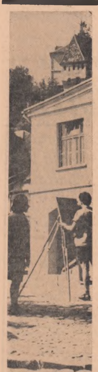
Vechea Sighișoara — sursă nouă de inspirație pentru artiștii plastici