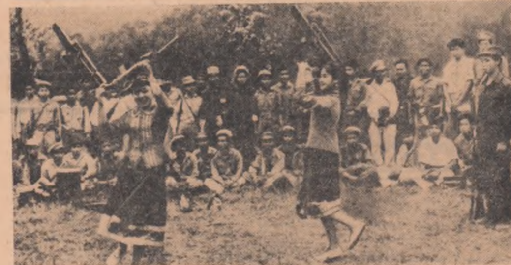
În clipele de răgaz: luptătorii din forțele patriotice din Laos asistă la un spectacol prezentat de artiștii amatori din regiunile eliberate

Casa Albă a impus o aminare. Soarta „canalului nr. 2” va putea fi cunoscută cu întîzire. Oficial se pretinde că termenele stabilite anterior pentru adoptarea unei hotărîri ar fi prea scurte și că cei chemați să-și prezinte propunerile întîmpină dificultăți de ordin politic, economic și militar. Explicațiile rămîn, totuși, vagi și neconvîngătoare. Realitatea trebuie descifrată dincolo de textul declarațiilor publice.