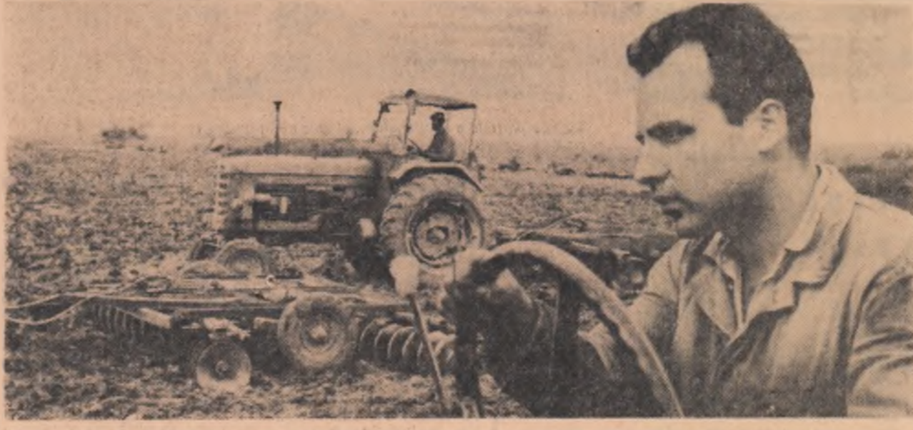
Pregătirea terenului pentru însămânțările de toamnă la G.A.S. Butea, regiunea București