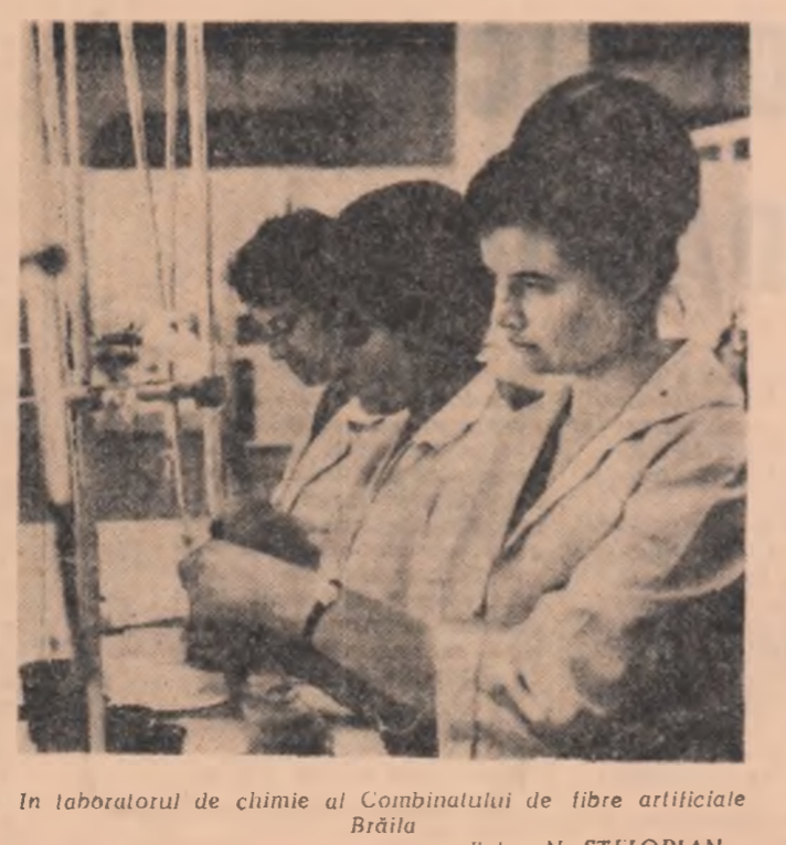
În laboratorul de chimie al Combinatului de fibre artificiale Brăila

El munceşte în dreptate, / Şi ia leala nămătată, / Şi mîncare-acea parte. Săracii erau cei rămaşi în sat, străci erau cei care porneau altele la oraş să capete de lucru. Cîntecul acesta, era un cîntec de jale în care erau plîns şi vîr şi morţii. Şi cei rămaşi în sat şi cei plecaţi trăiau cu speranţa că vor vedea pe cei dragi, că vor şti că de stăpîni, că vor fi iar împreună.