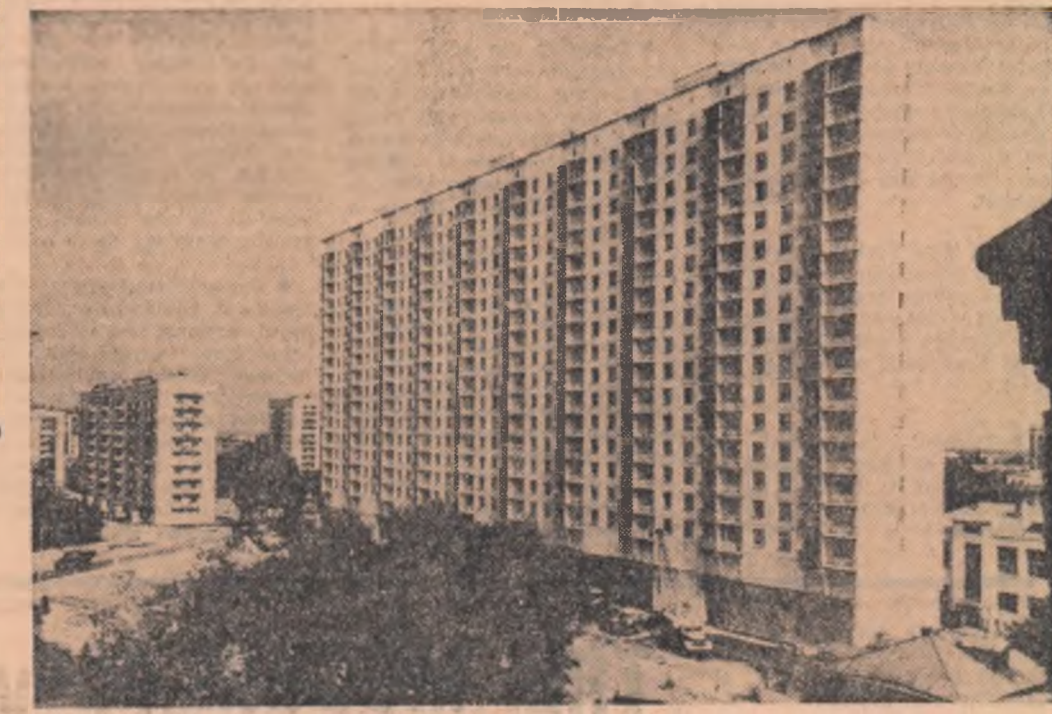
U.R.S.S.: La Moscova a fost terminată construcția primei case experimentale din elemente vibrolaminatate. Ea are 348 apartamente. În fotografie: noua construcție