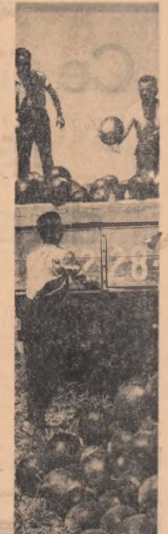
Recolta bogată de pepeni se traduce și în acest an la cooperativa agricolă de producție din Bragadiru, regiunea București, în veniturile de zeci de mii de lei