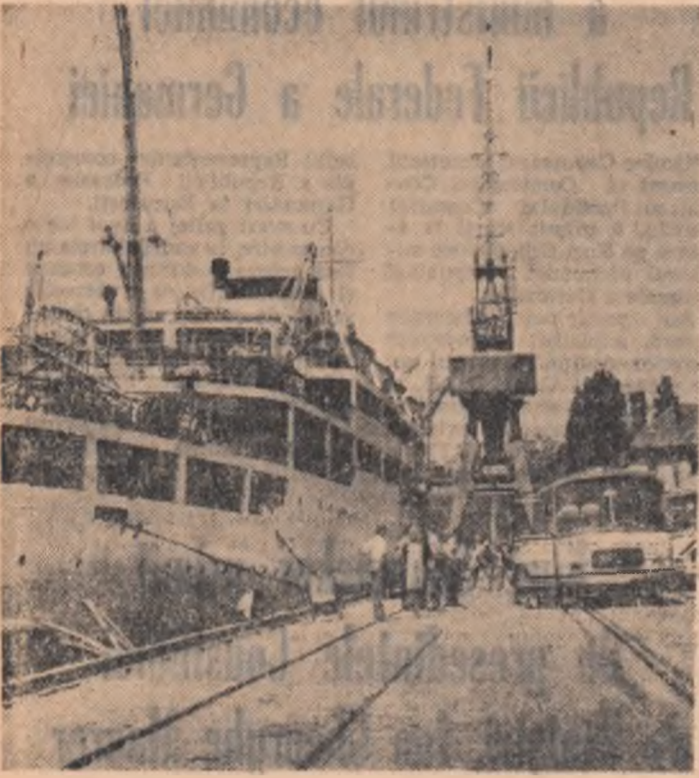
In portul Constanța