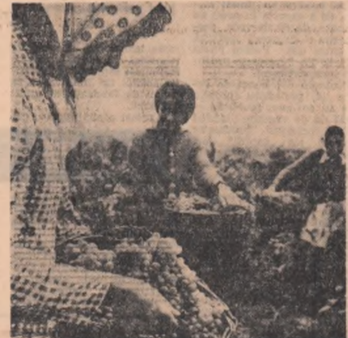
Se apropie toamna...

CUT ION secretar al comitetului comunal U.T.C.