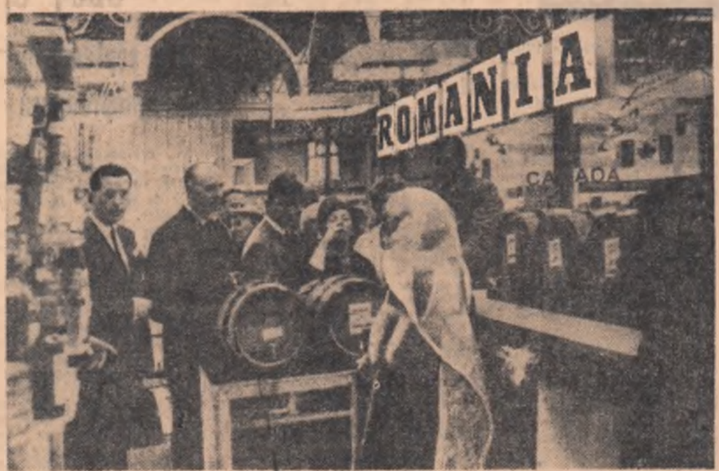
Prin ingenioasa ideea arhitecturală și prin varietatea și calitatea produselor expuse, pavilionul românesc la Tîrgul britanic de produse alimentare, deschis acum cîteva zile la Londra, atrage atenția vizitatorilor, bucurîndu-se de unanime aprecieri și elogi. În fotografie: aspect din acest pavilion