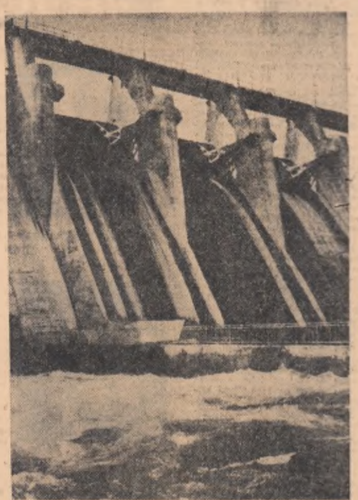
Barajul rezervorului de apă de la Seuhung. Apa acestui rezervor servește la irigația terenurilor agricole din provincia Hwanghailu de Nord

Majoritatea cîmpurilor din Coreea de nord se situează pe lîngura râului de vest. Proiectele de irigație trebuie să țină seama de condițiile topografice: trebuie să se amenajeze baraje prin îndiguirea râurilor, trebuie să se instaleze