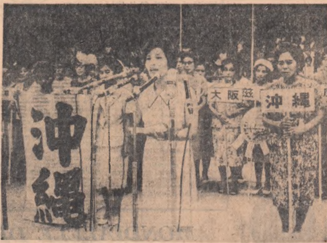
La Tokio s-a desfășurat conferința mamelor japoneze. Cele peste 10.000 participante au protestat împotriva agresiunii S.U.A. în Vietnam și și-au exprimat solidaritatea cu poporul vietnamez

Asasinarea premierului rasist sud-african Verwoerd a avut efectul obișnuit al evenimentului de senzație. Felul în care s-a desfășurat atentatul, similitudinea cu alte momente din istoria Africii de sud au alimentat primele comentarii. De fapt însă moartea lui Verwoerd ridică probleme politice limitate, dacă ne gîndim la efectele acestui eveniment pe plan intern sau la eventuala lui repercureare în relațiile R.S.A. cu Anglia și țările Commonwealthului.