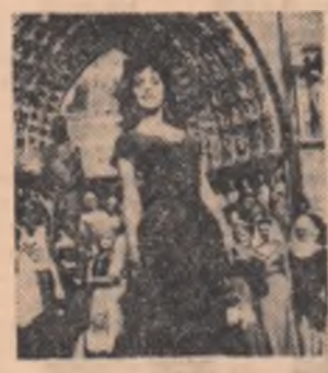
Esmeralda din „NOTRE DAME DE PARIS”