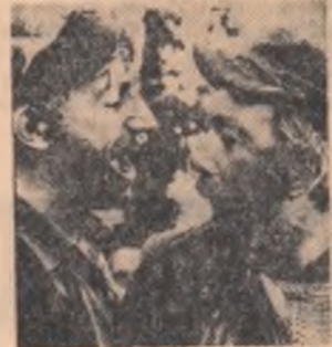
Unul din cele trei roluri în care vom revizita pe Anthony Quinn, în „ZORBA GRECUL”