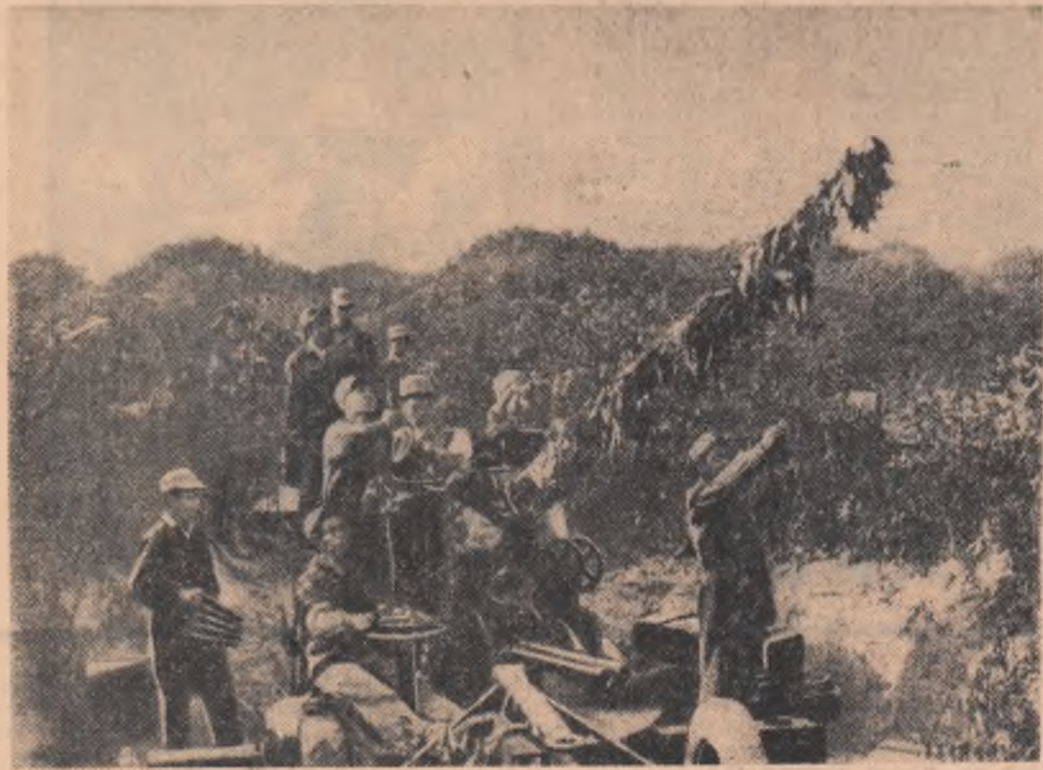
Unitate a forțelor patriotice laotiene în timpul unui exercițiu de luptă

Sezonul estival spaniol este în plin apogeu. Vacanța politică și diplomatică se află în toi. Majoritatea miniștrilor sînt plecați la vilele particulare din San Sebastian. Atmosfera destinsă, de „vacanță”, nu e, însă, decît aparentă.