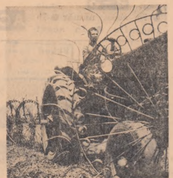
La cooperativa agricolă de producție Grîndu din regiunea București a început recoltatul celei de a 7-a coase la lacteind.