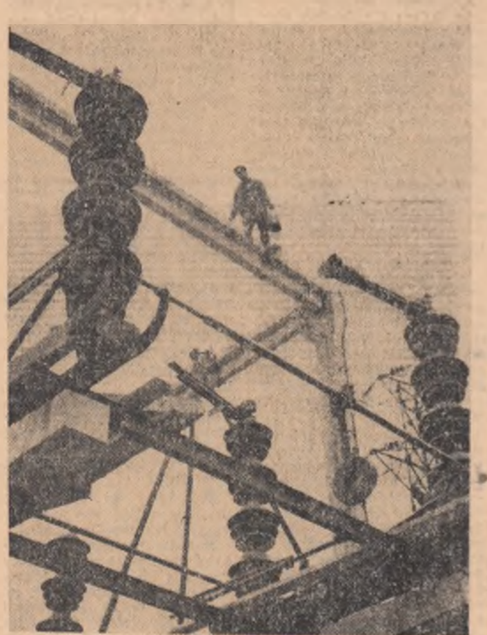
R. P. BULGARIA. Pe șantierul Termocentralei „Devia” din regiunea Varna

Încă din primul an al puterii populare, geologii care sfereleau pămîntul și specialiștii din laboratoare și-au spus cel dintîi cuvîntul în legătură cu rezervele de materii prime și produsele chimice care se pot scoate din ele. Inițial, s-a pus accentul pe producția de îngrășăminte minerale necesare ogoarelor. Ca urmare, pe baza rezervelor de cărbune interior, cu putere calorică mică, s-a construit și dat în folosință, cu 15 ani în urmă, prima unitate — Combinatul chimic din Dimitrograd, Tînrului colectiv, abia inițiat în tainele chimiei, a dat atunci economiei naționale primele cantități de amoniac și acid sulfuric. De atunci „primul născut” al acestei ramuri a fost lărgit în mai multe rânduri, iar acum realizează 36 de sortimente. Recent, harnicul colectiv al combinatului a obținut un nou produs — urotropina.