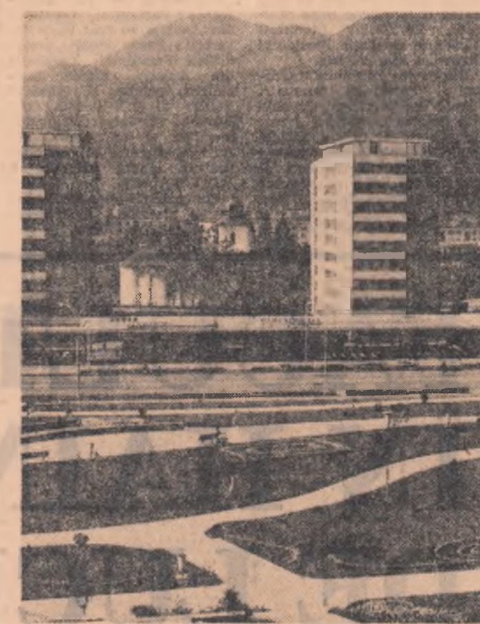
Din noul peisaj al orașului Piatra Neamț.

Așa cum îmi aduc aminte de prima mea învățătoare care, atunci cînd am împlinit 7 ani, m-a învățat să fac primele bastoane și, mai tîrziu, primul a, tot așa nu-l pot uita pe maestrul care m-a învățat meseria de lăcătuș.