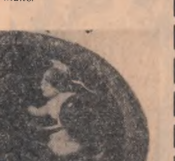
Camee de sardonix reprezentînd un car mînat de zeita Athena, încrustată într-un inel de aur, Import roman din secolul I e.n.

straturi se oprește la sfîrșitul secolului I e.n. Ultimele monede descoperite în săpăturii datează din vremea împăratului Vespasian. Avem dreptul să deducem că acest bogat și puternic centru geto-dac a fost suprimat de romani sub domnia lui Domițian cu prilejul războaielor acestuia împotriva lui Decebal. După pacea încheiată între cei doi adversari la anul 89, Moldova de Jos, (ca și Muntenia), ieșea de sub influența regelui dac, rămînd sub aceea a romanilor. La începutul domniei lui Traian este atestat, ca străjind la Piroboridava, un detașament al unei trupe romane.