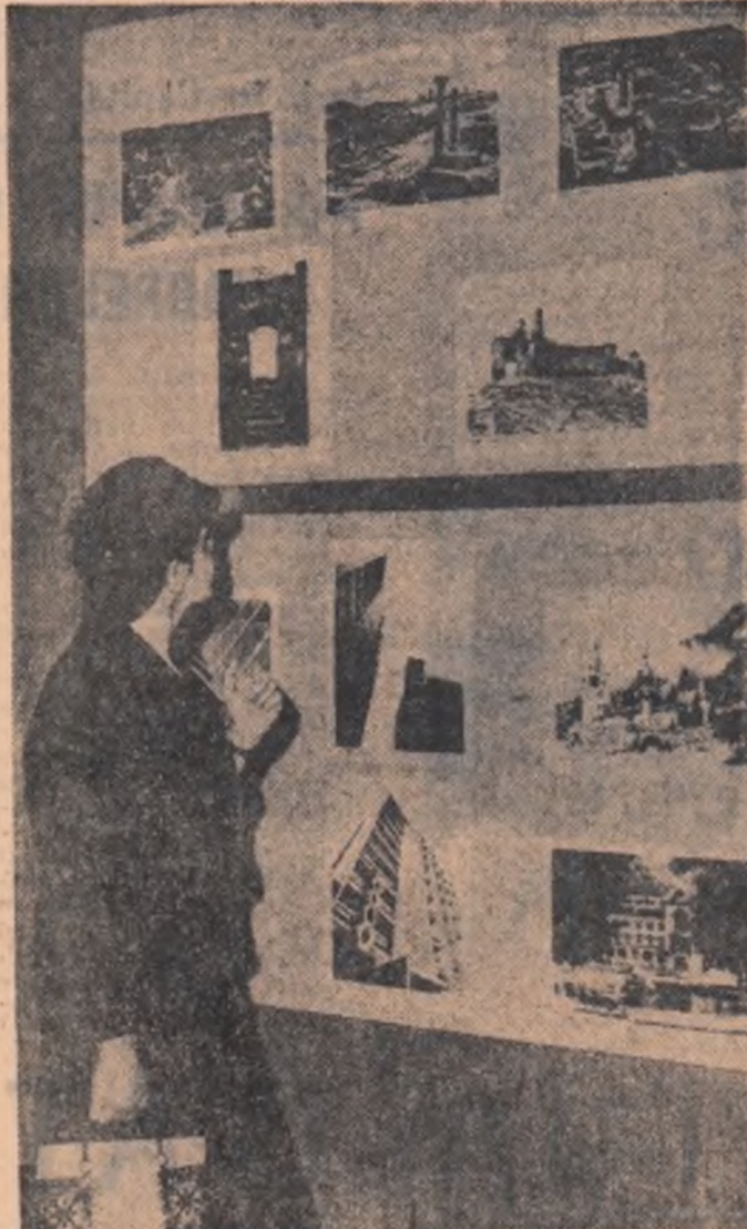
La Varșovia s-a deschis recent o expoziție de fotografii care înfățișează realizările României socialiste

După-amiază pe estradele din piețele publice și din parcuri s-au desășurat serbări populare.