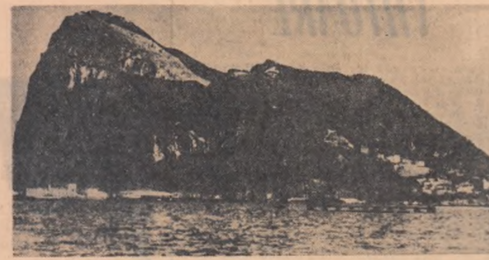
Obiectul disputei anglo-spanole: Gibraltarul

Cu un stegiu mai mare sau mai mic, pe diferite meridiane și la felurite distanțe, în lumea se desfășoară multe discuții interminabile.