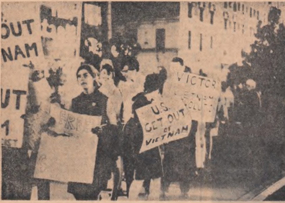
S.U.A. — Demonstrație de protest la New York pentru retragerea trupelor americane din Vietnam

LA MOSCOVA a fost dată publicității hotărârea C.C. al P.C.U.S. și Consiliului de Miniștri al U.R.S.S. privind îmbunătățirea pregătirii specialiștilor și intensificarea activității de cercetări științifice în instituțiile de învățământ superior din țară.