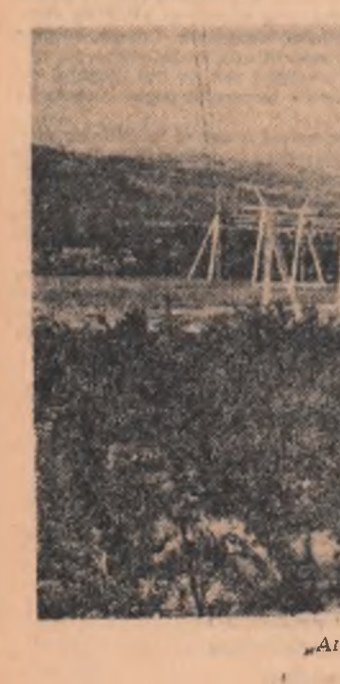
„Arterele” energiei străbat Valea Oitului

Din inițiativa Consiliului agricol regional, la Casa a agronomului din Cluj a avut loc un instructaj privind mîntuirea îngrășămintelor chimice la care au participat ingineri agronomi din cooperative agricole de producție. Expunerile au fost susținute de către cercetători și specialiști cu o înaltă calificare de la Institutul agronomic din Cluj și de la stațiunile experimentale din regiunea agricolă.