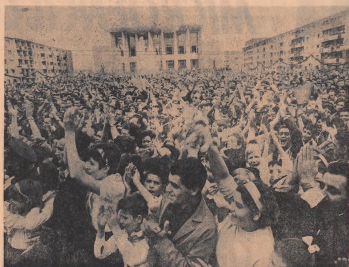
Cu înfățișare li acamă participanții la mitingul de la Bacău pe conducătorii de partid și de stat

În cadrul planului cincinal, îndatorirea de a vă spori ca forțurile pentru a asigura ca sarcinile de plan să fie în întregime îndeplinite. În orașul dv. urmează să se construiască o serie de secții și întreprinderi noi, — și ele trebuie realizate la timp. Va trebui să ne îngrîjim ca fiecare leu cheltuit să aducă maximum de venit pentru poporul nostru, ca fiecare întreprindere, fiecare secție să lucreze cu maximum de eficiență economică. Trebuie să asigurăm produse de înaltă calitate, care să se poată compara cu oriicare produs similar de pe piața mondială, să organizăm mai bine producția, să sporim productivitatea muncii în așa fel încît obiectivele stabilite de Congresul al IX-lea al partidului să fie îndeplinite în toate domeniile. Astfel și dv., oamenii muncii din Bacău, vă veți aduce contribuția, alături de toți oamenii muncii din țara noastră, la dezvoltarea economiei. Înflorirea României. Aceasta este o dîndre îndatorire patriotică, de onoare ale fiecărui cetățean al țării noastre. Fiecare la locul său de muncă trebuie să facă totul pentru ca zi de zi, ceas de ceas, țara noastră să devină