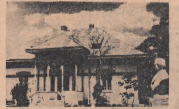
Casa memorială de la Ipotești

Se știe puțin despre această Ileana, care trăiește biografic în aparatul faptic al poemei Mortua este și cu vremea se vor putea adăugi informații despre viața Ileana, ipotezează moartea de copilă. Meditațiile lui Eminescu din ciclul „Iubite de la Ipotești” păstrează crisalida acestei înflăcăvări. Primele prietenii, valorificarea poeziei populare, căutarea izvoarelor, privilegiata ogoarelor și a lacului, măreția cîdrului acceptat confident, înțita iubire — sînt din Ipotești și ele aparțin perimetrului moral al copilăriei poetului. Intemelat în anii puterii populare, Muzeul Mihai Eminescu din Ipotești documentează pe pelerinii preturitori ai liricii eminesciene din țara noastră și de peste hotare asupra vieții marelui clasic român, iar peisajul ipoteștean îi se comunică fără mijlocie confidentă, cu o frumusețe fără sfîrșit.