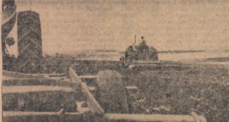
Pregătirea patului germinativ, pen-ru viitoarea recoltă de grâu la cooperativa agricolă Vișoara