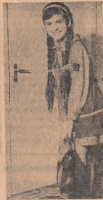
Mîine din nou la școală