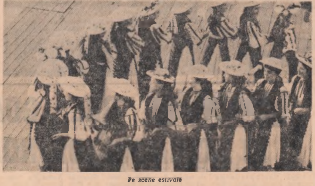
Pe scene estivală

— Moda bărbătească — mai lentă în evoluție — ce noutăți aduce în actualul sezon?