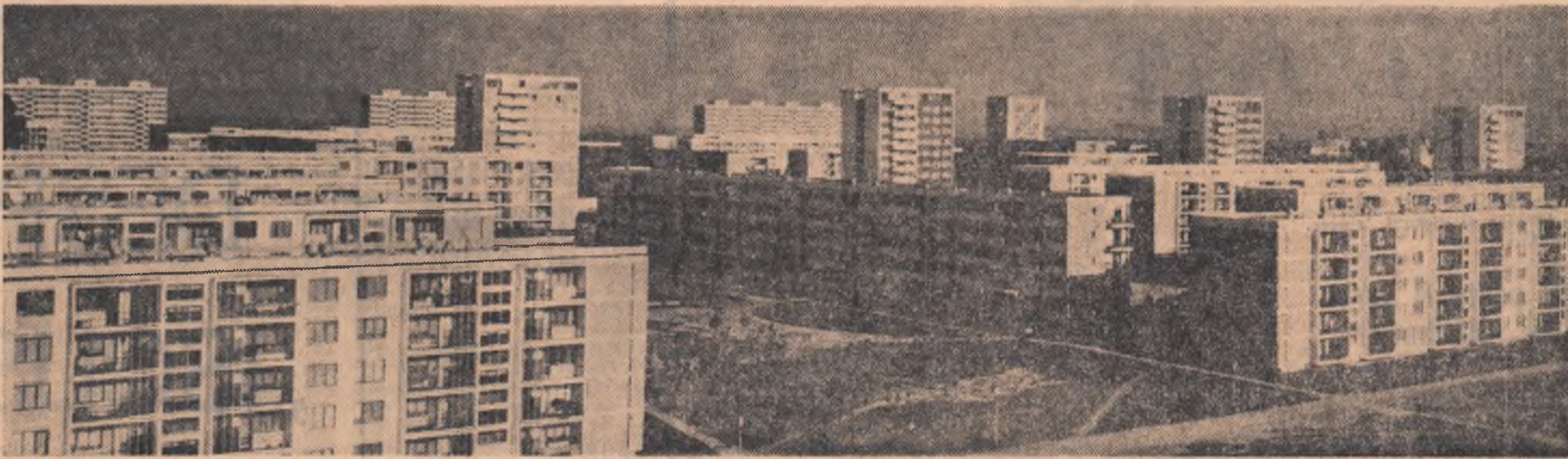
In cartierul Tiglina din Galați