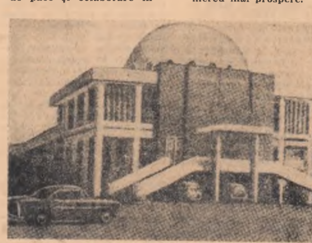
Imagine din capitala Republicii Mali — Bamako