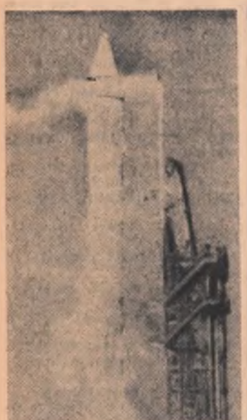
Aspect de la lansarea lui „Surveyor-2”

Administrația națională a S.U.A. pentru problemele aeronauticii și cercetarea spațiului cosmic (N.A.S.A.) a anunțat că sonda lunară „Surveyor-2”, lansată marți în direcția Lunii își continuă zborul. Miercuri la ora 5:02 GMT s-a procedat la o manevră pentru corectarea orbitei inițiale. În acel moment „Surveyor-2” se afla la o distanță de 163.346 km de Pământ și 229.378 km depărtare de Lună.