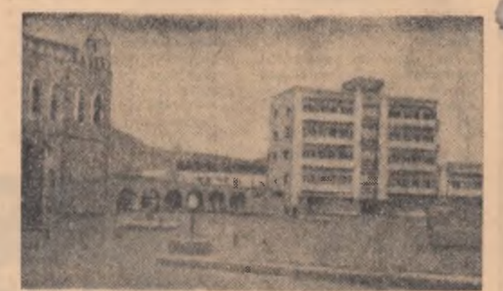
Vedere din Sanaa

Poporul yemenit sărbătorește astăzi un eveniment deosebit însemnat în istoria sa milenară: se împlinește patru ani de la proclamarea Republicii Arabe Yemen.