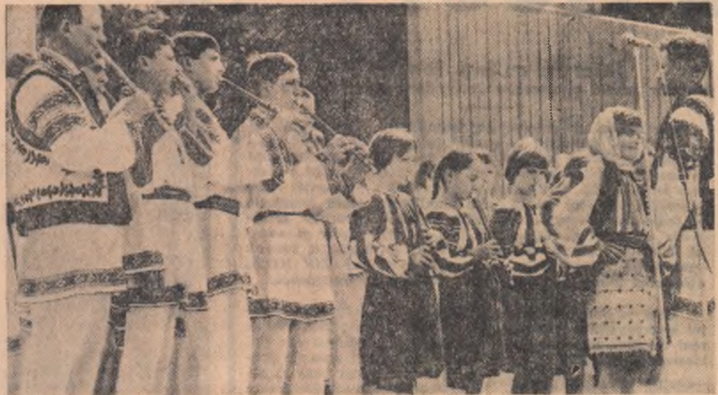
Melodiile populare interpretate de formațiile din comunele Bălteni și Dragalina (regiunea Iași) unesc nu numai în sala ci și pe scenă mai multe generații