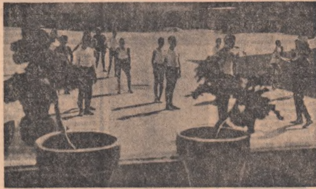
Ord de educație fizică la Școala generală de 8 ani nr. 122 din Capitală

Un vast cîmp de activitate creatoare se deschide și în fața cercetării academice prin programul unitar al cercetării. Sărbătorind centenarul Academiei, toți cei care lucrează în cercetare la acest nivel înalt — alături de oamenii de știință și de cercetători din întreaga țară — își sporesc hotărîrea de a răspunde cu cinstite sarcinilor trasate de partid, să continue cu noi și noi realizări luminoase tradițiile românești academice.