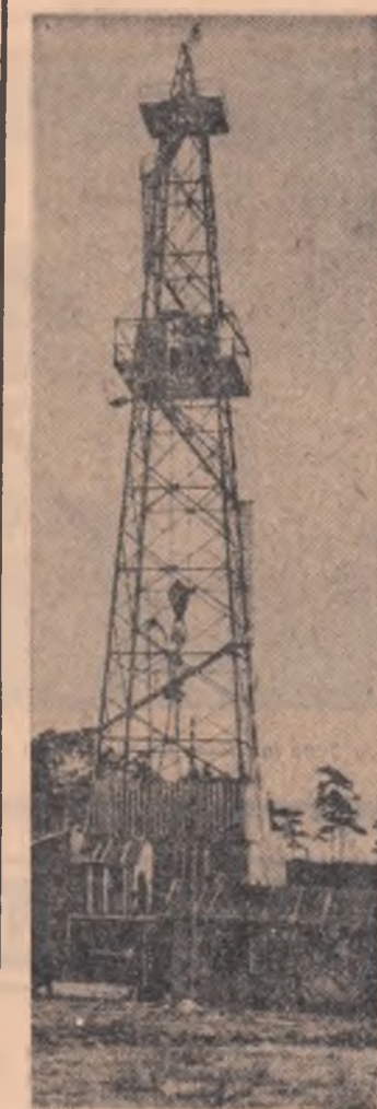
R. P. POLONĂ. — Sondă pentru prospectarea zăcămintelor de gaze naturale la Lubaczow