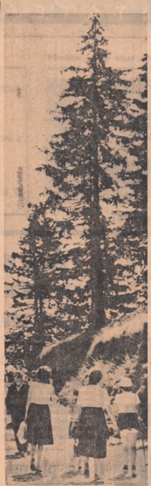
In drum spre Coia 1400