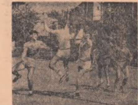
Sesizînd lișura blocajului, atacantul sutează.