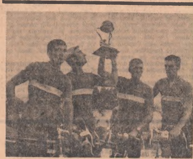
Echipa orașului București, cîștigătoare „Turului României” ediția a XV-a