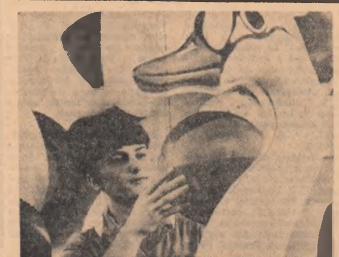
Fabrica de mase plastice „București”. Un nou lot de jucării pentru copii

18,00: Emisiune pentru copii și tineretul școlar; 19,00: Telediscurile de seară; 19,20: Din lirica lui Camil Petrescu; 19,30: Cabinet medical TV; „Pericolul intreruperilor de sarcină” — emisiunea a II-a; 19,45: Filmul documentar și clasicii săi; Robert Flaherty; 20,00: Telemiscuna economică — Transmisiune în direct de la Institutul de cercetări științifice pentru protecția muncii; 20,30: Seară de teatru: „Mina cu cinci degete” — parodie polifonă de Mircea Crișan. În pauză: Poșta televiziunii; 22,15: Varietăți pe peluclă; 22,30: Telediscurile de noapte; 22,40: Buletinul meteorologic; 22,45: Închiderea emisiunii.