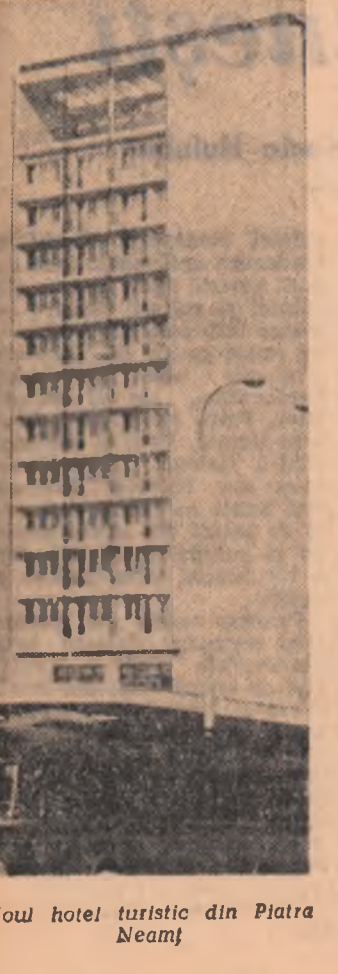
Noul hotel turistic din Piatra Neamț