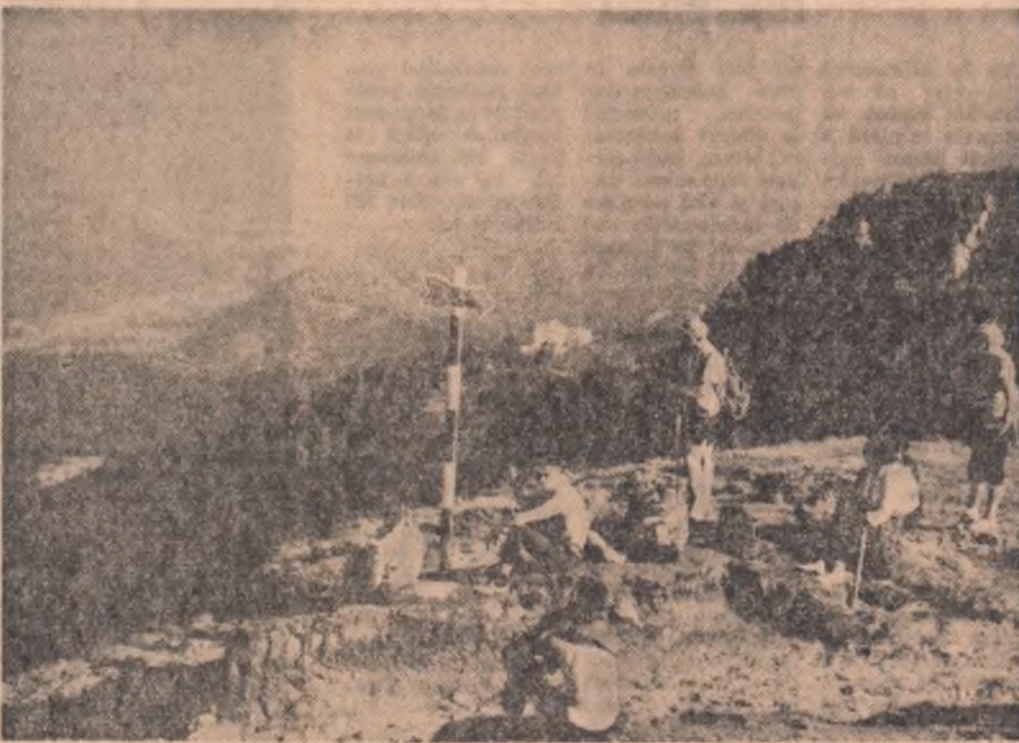
Turisti pe Munții Bucegi

școală, elevii, pionierii, în ce măsură ar putea lua mai bine contact cu trecutul istoric al patriei dacă nu îngrijind și cunoșcînd valoarea monumentelor? Una din principalele preocupări ale organizației U.T.C. din școală, aceasta ar trebui să fie! Sînt nenumărate monumente istorice, în vecinătatea satelor, unele chiar pe lângă școli: ar fi fost foarte mult grupurilor de