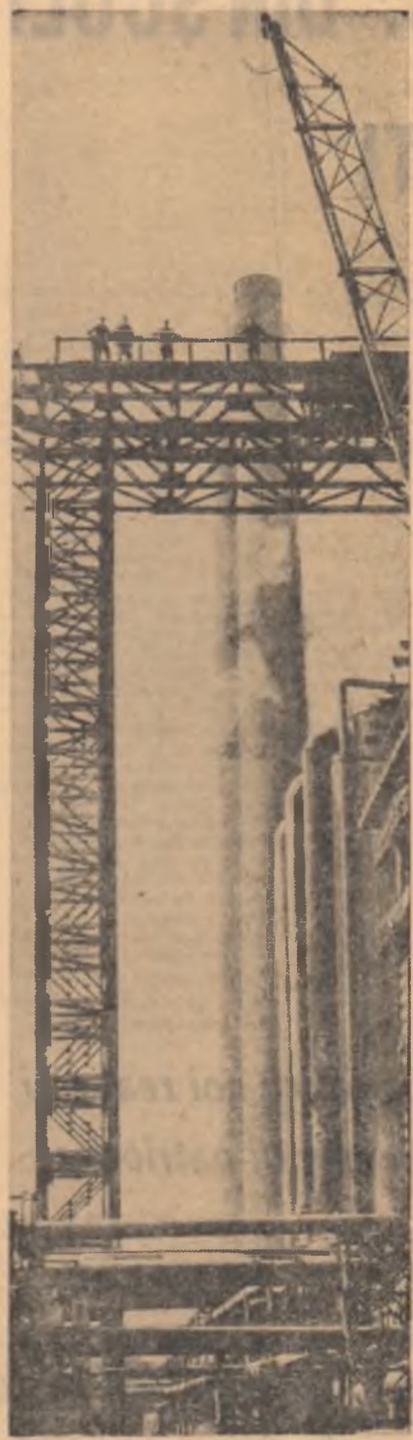
U.R.S.S. — În curînd va intra în funcțiune bateria de coacă care a fost construită la Combinatul metalurgic din Orsk-Haliolovo. În anii cîinului, la combinat se vor construi de asemenea, un furnal, două laminare, o secție otelărie, secții auxiliare. În fotografie: noua baterie de coacă