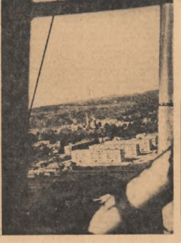
Construcții noi la Moreni

În toate centrele universitare din țară, deschiderea noului an de învățămînt universitar a fost marcată prin festivi- tăți entuziaste, la care au luat parte cadrele didactice și stu- denții, reprezentanți ai orga- nelor locale de partid și de stat, oameni de știință, cul- tură și artă.