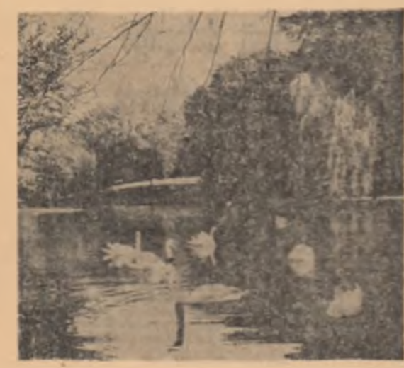
Parcul Libertății din Capitală