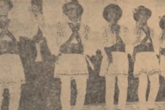
O imagine care nu cere explicații: călșariii