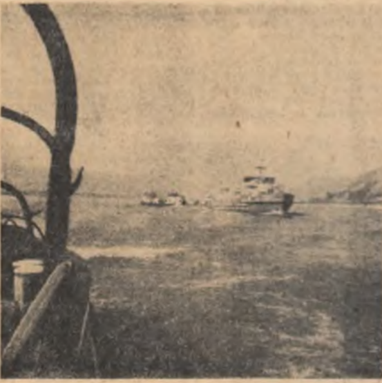
Remorciera pe Dunăre