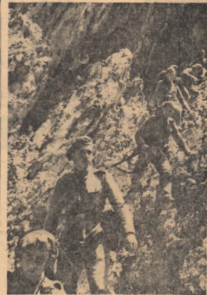
O grupă de vântori de munte într-un exercițiu tactic

Școala, situată într-un cadru pitoresc, unde la marginea unui oraș de la poalele Carpaților, pregătește cadre de ofițeri pentru forțele armate ale țării cu o largă diversitate de specialități: ofițeri de artilerie, infanterie, aeronautică, transmisiuni, ofițeri chimiciști și topografi, cadre, paralele cu instrucția militară, fac și o pregătire tehnică superioară, astfel că la isprăvirea celor 4 ani de studii ei