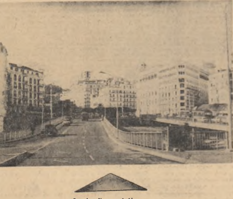
Imagine din orașul Alger