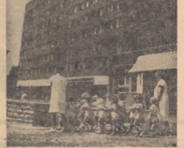
R. F. UNGARĂ — Construcții noi la Dunajvaros

JAPONIA: 8.000 de studenți ai organizației recente o demonstrație pe străzile orașului Tokio împotriva politicii S.U.A. în Vietnam