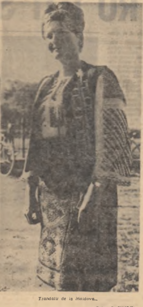
Trandafii de la Moldova...