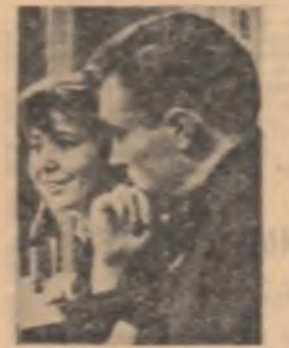
La 70 ani, la 50 de ani incepe sa se estesească deopotriva. Textul este situat pe principiul nostru de muncă, de viață.

secinta imediată a continuitatii in muncă.