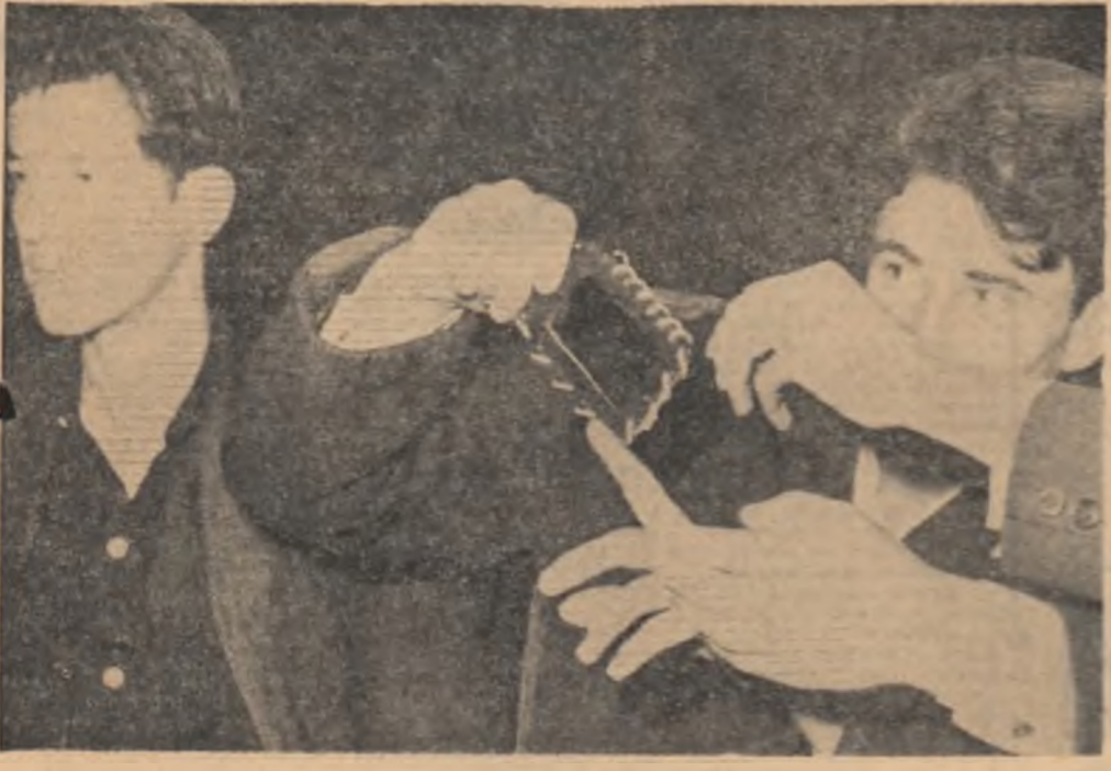
Cetăria. Primul contact cu Hunedoara, primul îndemn adresat tinerilor: „Priviți hădăurile care topec metalul. Nu-i greu să le sădăpăniți, să le dirijezi și nici să înalți coloșii care-i adăpostesc ciocotul. Trebuie pentru asta să menții în permanență nestînsă hădăra din propria ta inimă”

Dezbateri largă, multilaterală și plină de răspundere a prevederilor proiectului de lege a pensilor sîrilește în toată țara, în toate colectivele de muncă, manifestarea entuziasată a încrederii profunde a întregului nostru popor în politica partidului, a hotărîrii de a lăsați cu toată priceperea, responsabilitatea și abnegația, mărețul program de înălțare multilaterală a României socialiste, stabilit de Congresul al IX-lea al P.C.R.