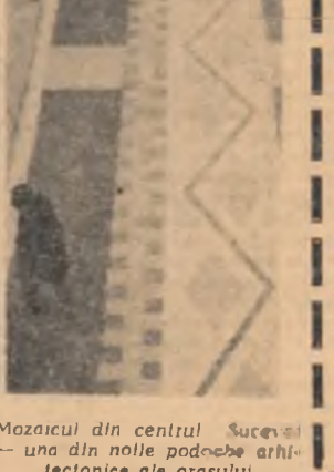
Mazacul din centrul Sucevei — una din nobile poezii arhitectonice ale orașului