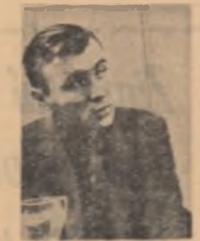
La 70 ani, la 50 de ani incepe sa se estesească deopotriva. Textul este situat pe principiul nostru de muncă, de viață.