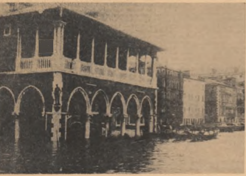
În urma inundațiilor care au avut loc în Italia au fost avariate șosele rurale pe o distanță de 5.000 kilometri și aproximativ 800.000 hectare pămînt arabil. Totodată, a fost distrusă parțial 12.000 ferme agricole, 24.000 mașini agricole. Cît privește șeptelul, au fost pierdute 50.000 capete bovine. În fotografie: Canalul Grande din Veneția după recentele inundații

La Salisbury acoliții lui Smith au sărbătorit vineri cu surle și trîmbițe împlinirea unui an de la proclamarea unilaterală a „independenței” Rhodesiei. De fapt anul care s-a scurs a fost mai ales un an de ofensivă din partea Salisbury-ului și unul de șovăieli, de nehotărîri, din partea Londrei. Summarum a fost un an ciștigat de Smith.