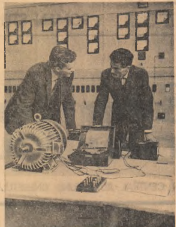
In laboratorului de mașini electrice al Institutului poli-tehnic din Cluj

ANUNȚURI, RECLAME... CU CÎNTEC. Vizitați baza sportivă din pădurea Monumentului din Brăila. FRIGIDER PE DOUĂ OSII. Toată lumea știe că alimentele se păstrează în bune condiții folosind frigiderul Fram.