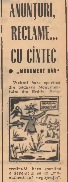
treținută, baza sportivă a deșenti și ea un „monument... al neglijenței”.

SEARĂ DE POMINĂ. Oricine dorește să-și înfrunceze timpul liber, e... liber să meargă la dans simbată seara la cluburile exploătorilor miniere din Asău și Comănești. Tinuta neobligatorie dar frecven-