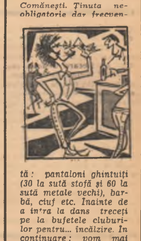
Concurs pentru rezistența... nervilor

CONCURS PENTRU REZISTENȚA... NERVILOR. Pentru aceasta nu e nevoie să urmăriți un meci de fotbal între două echipe slabe, ci să vizionați un film la cinematograful „Studio” din Timișoara. Cine rezistă două ceasuri la scripștii scaunelor înseamnă că are nervi de oțel. O mențiune: din 712 scaune 639 scripștii. Cele care tac sînt neocupate.