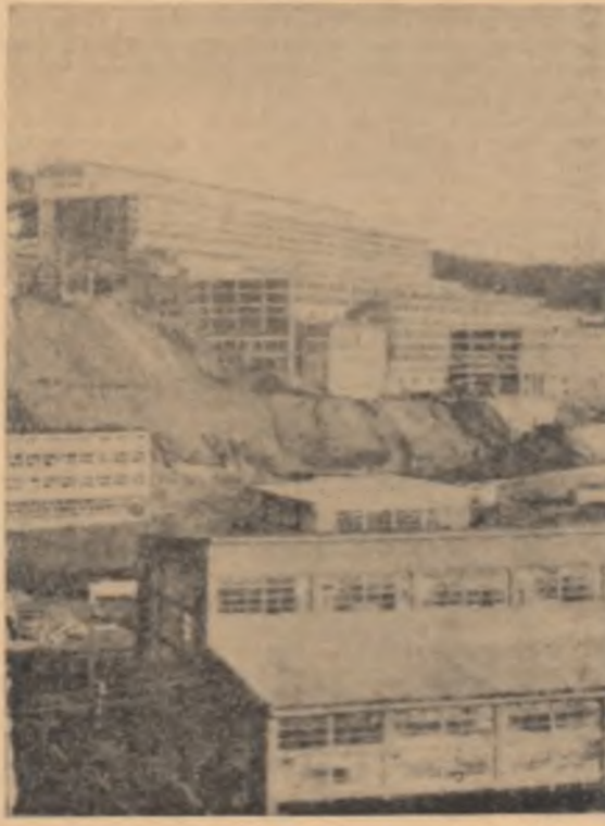
R. P. BULGARIA. Vedere exterioră a Combinatului de innohilare a minereurilor „Melet”

Un grup de membri ai unor comitete ale O.N.U. a căror activitate este direct legată de problemele spațiului cosmic au fost invitați să asiste la