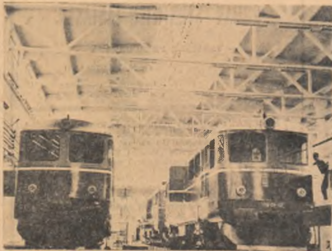
Noua hală de reparării și revizii curente dată în folosință în acest an la Depoul G.F.R. București-Triaș.

La Bals, în regiunea Oltenia, au început lucrările pe șantierul uzinei de reparării a utilajelor agricole — nou obiectiv industrial prevăzută a se construi în al doilea an al cincinalului. Amplasat într-un perimetru destinat unei noi zone industriale, uzina formează un ansamblu unitar obținut prin comasarea clădirilor și depozitelor anexa cu hala principală de producție. Activitatea de bază a uzinei se va desfășura în secția de reparării a tractoarelor și motoarelor și secția de piese de schimb și utilaje.