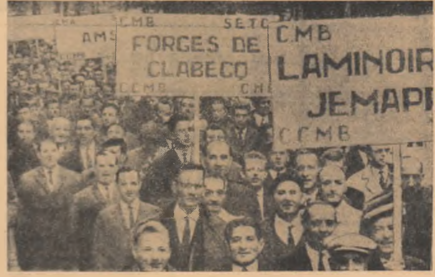
BELGIA. Aspect din timpul unei manifestații a muncitorilor metalurgiști din Liège, în sprijinul revendicărilor lor economice, împotriva concedierilor