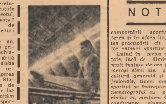
Moment de încordare într-un exercițiu de gimnastică la para-