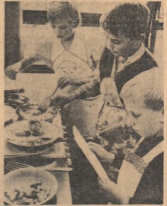
Urno și repulsie

Ultimele rezultate parțiale ale alegerilor municipale care au avut loc duminică în Peru arată, potrivit agenției FRANCE PRESSE, o repulsie netă a corpului electoral față de celeștia partidelor de guvernământ „Acțiunea populară” și „Partidul democrat creștin”. Cu excepția victoriei candidaturii guvernamentale, obținută în capitală, în majoritatea localităților din provincie candidații opoziției, respectiv cei prezentați de partidele Alianța populară revoluționară americană (APRA) și Uniunea națională Odrista