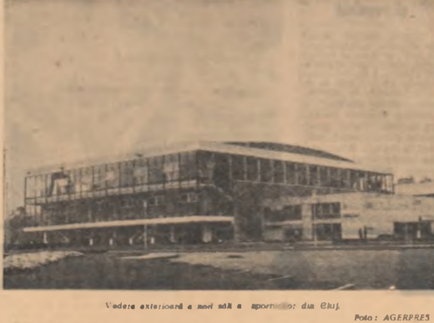
Vedere extensivă a noului aeroport din Cluj.