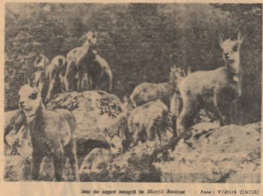
Iași de capre negre în Muștii Plată Craiova.

În total pe regiunea Argeș și Brașov, care posedă cele mai mul-te exemplare de capre negre din muștii Plată Craiova, Brașov, Fă-găreș, Lotru și Căpățînă, au fost numărate 3 065 exemplare. Aceasta este o dovadă a grăii acordate ocrotirii monumentelor naturii.