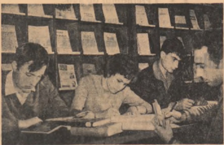
În căutarea noii, studenții posedă...