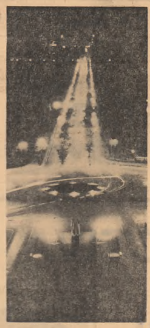
Nocturnă în Piața Sclintelii

Design, Modelare și re-gistrare stabilite și și atudenți din învățămîntul se-cular beneficiază, pentru exa-menarea de an și examenul de stat de un concediu de studii plătit de 30 zile calendaristice în starea con-diciilor de odihnă.