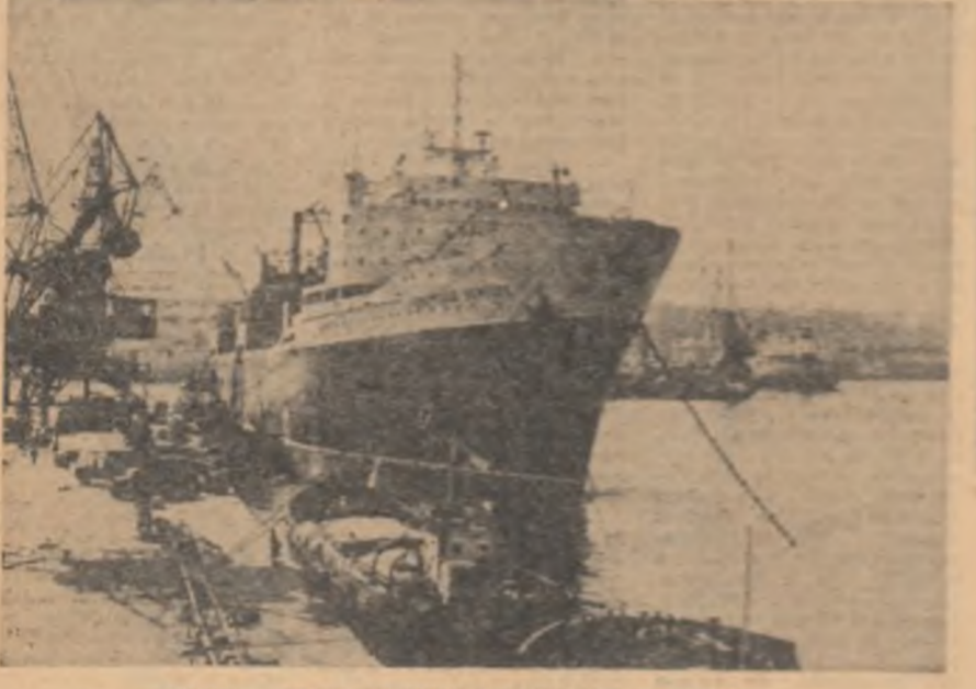
L.R.S.S. — Vasul „Seveiskaya Ukraina” în portul Odessa

Primele observații ale scrutinului de marți din Brazilia pentru desemnarea celor 409 membri ai Camerei Deputaților și o treime din membrii Camerei Superioare se referă la participarea la vot.