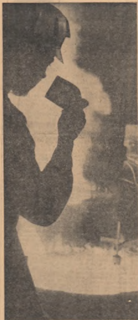
Priviri spre întințările șantierului.

PLANUL DE INVESTIȚII PE ȘANTIERELE CINCINALULUI