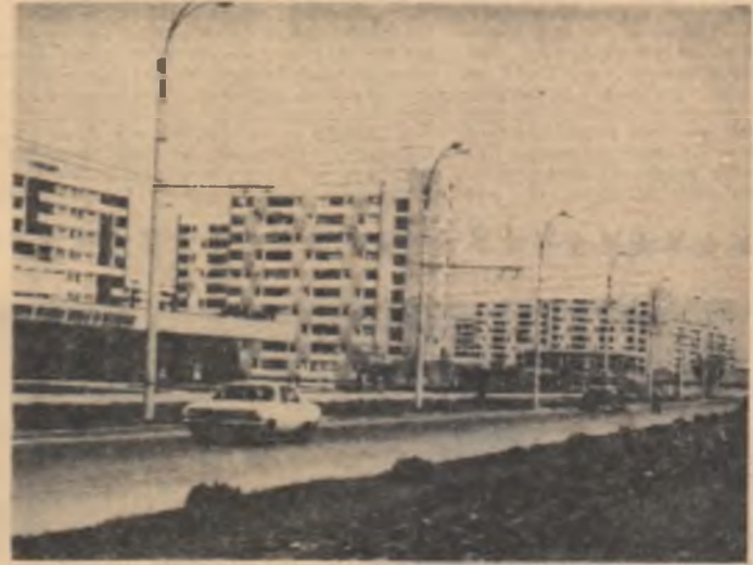
Din noul peisaj bucureștean: Drumul Taberei.

Organizarea ace stui simpozion, cu un bogat conținut educativ, se în scrie acțiunilor me ante să dezvoltate la tineri dragostea și LAL ROMULES corespondentul „Scintei tineretului” pentru regiunea Brașov (Continuare în pag. a V-a)