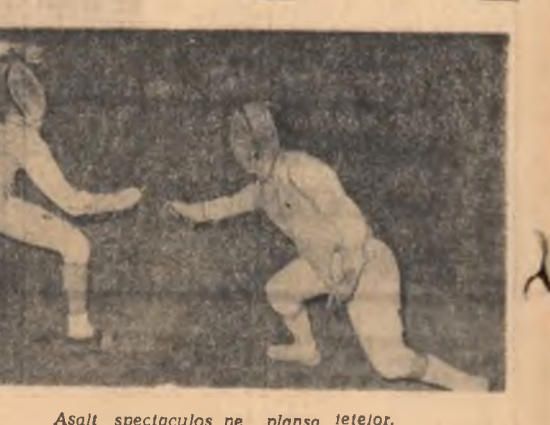
Asalt spectaculos pe planșa telor.

ultimela mecluri din returului campionatului au decis pe cîștigători, dînd astfel naștere la întîlniri deosebit de spectaculoase. Ceea ce am constatat cu mult satisfacție este echilibrul valoric care începe să se stabilească între primele cîștigate. De-a lungul returului, nivelul tehnic și tactic al înnoierilor a fost cu mult superior celui al celorlalți ani. Sintem siguri, așa, de fapt cum am mai spus, că aceasta este urmarea angrenării scrimerilor într-o competiție individuală de mare importanță „Cupa României”, în această a doua parte a anului. Considerăm că îmbucurătoare gruparea mai multor echipe în lupta pentru primele locuri dispărîndu-se anticipație a configurației clasamentului. În afara învingătorilor, merită toate felicitările, trebuie să consemnăm buna comportare a echipelor Universitatea Buc., (floretă masculin), Progresul Buc., (floretă masculin), Universitatea Buc. (floretă feminin), I.M.F. Tîrgu Mureș, C.S.M. Cluj (spadă), S.P.C. Buc., Universitatea Buc., Dinamo Brașov (sabie). OCT. VINTILA maeștrul al sportului