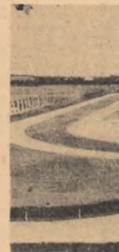
Pista pentru determinarea caracteristicilor de tracțiune la tractoare

recetătorilor în domeniul mecanizării agriculturii. În acest scop a fost îmbunătățită combina tractată de recoltat cereale, creîndu-se combina C-3, care are o productivitate mai mare.