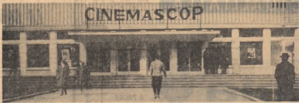
Noul cinematograful din Vatra Dornei

GALAȚI (de la încheierea... pentru a îndeplini sarcinile trasate de Congresul al IX-lea al P.C.R.)