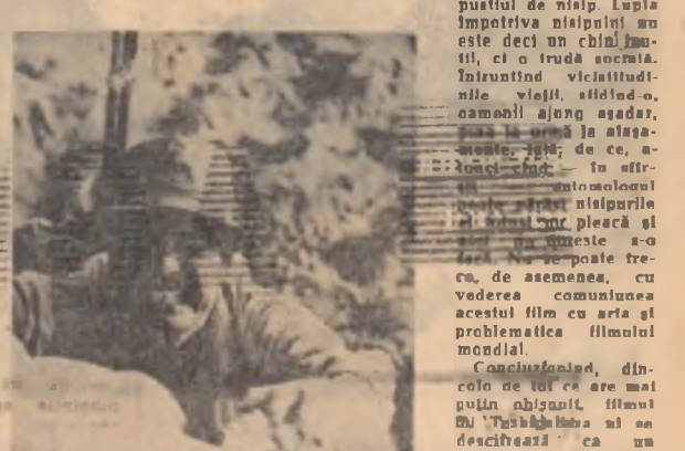
Cadru din filmul 'Femeia nisipurilor' ATANASIE TOMA