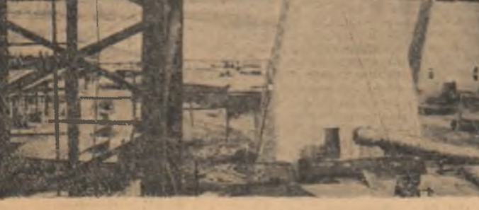
U.R.S.S. — Construcția minei „Komsomolski” din Talnah se desfășoară în ritm susținut. Nu va trece mult timp și bogatul zăcămint de polimetale din regiunea de dincolo de Polul Nord va putea fi dat în exploatare