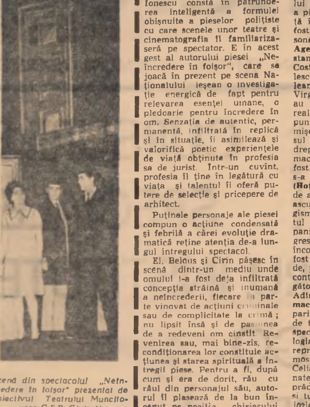
Scenă din spectacolul „Neîncredere în foișor” prezentat de colectivul Teatrului Muncitoresc C.F.R.-Giulești