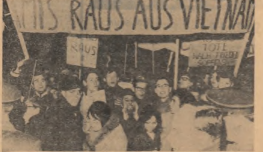
R. F. GERMANIA. — Recent la München a avut loc o demonstrație de protest împotriva politicii americane în Vietnam