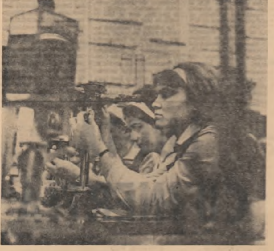
Privire către „secretele” fizicii (Oră de laborator cu elevii a Școlii de Fizică din Iași)