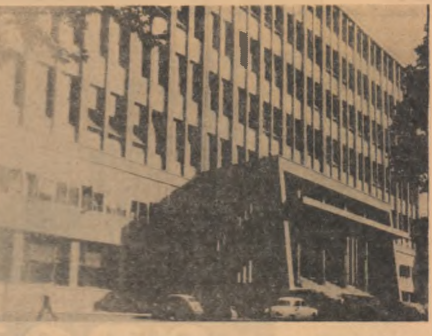
R. S. F. IUGOSLAVIA. — Noua clădire a Facultății de tehnologie din Ljubljana