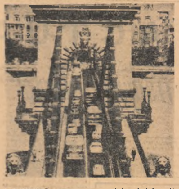
R. P. UNGARĂ — Unul dintre renumitele poduri de peste Dunăre