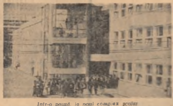
Într-o pauză la noul complex școlar