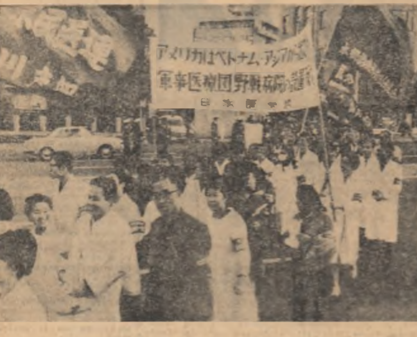
Vineri la prînz la Clubul muncitorilor din Hanoi s-a deschis expoziția „Arhitectura în Republica Socialistă România”. Fotografiile și machetele prezintă eforturile și succesele arhitecților și constructorilor în dezvoltarea și sistematizarea orașelor românești noi, centre industriale pe scară largă, construcțiile de locuințe în mediul urban și rural.