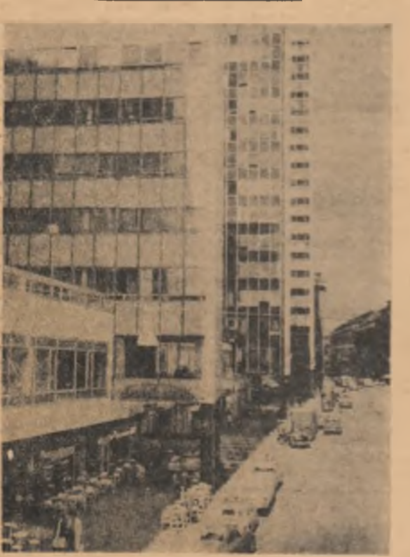
SUEDIA. Pe o stradă din Stockholm

psru zile”. Ziarul publică programul vizitei și biografia oaspetelui. Știrea despre vizită este însoțită de un amplu articol privind agricultura României și un articol intitulat „Educația se dezvoltă în România”. Știri despre vizită, însoțite de fotografia oaspetelui, au publicat și cotidienele „Addis Soir” și „Addis Zemen”.