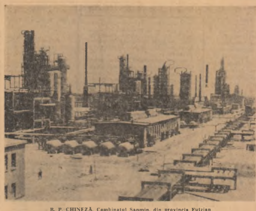
R. P. CHINEZĂ. Combinatul Sanmin, din provincia Fuțjian

Se mai așteptau la o înțelegere și numeroși observatori care, analizînd propunerile britanice, foarte favorabile premierului rhodesian, nu vedeau ce și-ar mai fi putut dori Smith: ceea ce i se cerea era