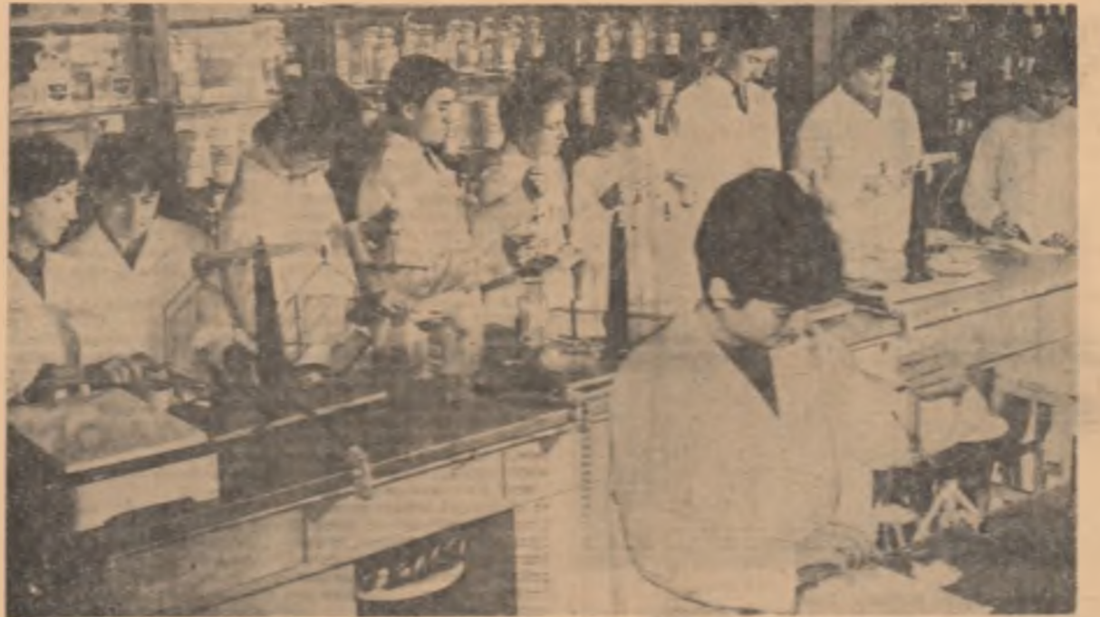
Oră de instruire practică pentru elevii anului I, secția farmacie, de la Grupul școlar sanitar București