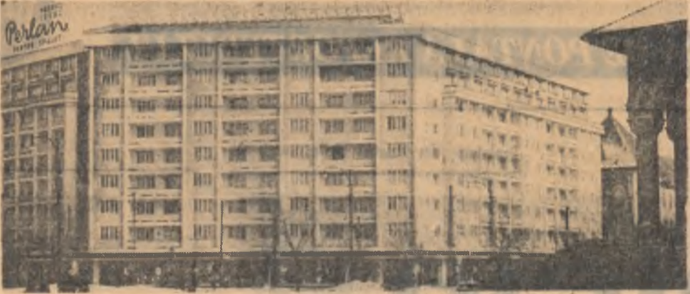
În centrul orașului Timișoara

complexității și subtilității sale, necesită un efort suprem de cunoaștere. Înarmat cu legile psihologiei, un psiholog poate să orienteze în mod corect atenția și interesul celor care îl caută.