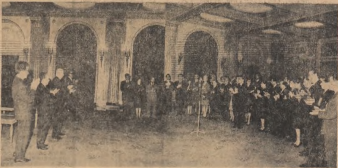
Aspect din timpul solemnității înmînării unor ordine și medalii