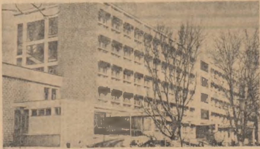
Vedere exterioară a maternității din Bacău