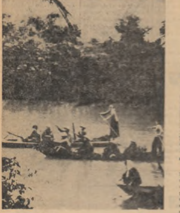
VIETNAMUL DE SUD. Ambarcațiuni cu luptători din rindurile forțelor patriotice pregătindu-se pentru independența unei noi națiuni