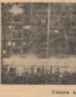
Vedere soarelui din orașul Georgea Gheorghiu-Dej