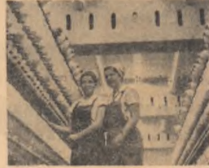
Toate întreprinderile industriale ale regiunii Iași și-au îndeplinit înainte de termen planul pe anul 1966. În foto: o imagine din secția filatură a Fabricii „Țesătura”.

● Din ultimele date soseite miercuri la Ministerul Industrii Metalurgice, rețese că planul producției de fontă prevăzut pentru acest an a fost îndeplinit la sfîrșitul primului schimb din această zi. Cantitatea de fontă realizată până acum este mai mare cu 8,8 la sută decît întreaga producție a anului 1965. Mai mult de jumătate din acest spor a fost realizat pe seama ridicării indicilor de utilizare a agregatelor.