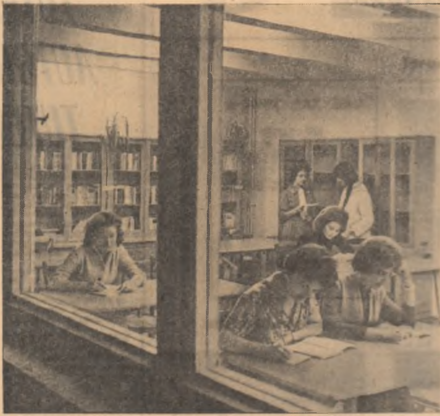
Complexul studențesc din Cluj. Aspect dintr-o sală de lectură