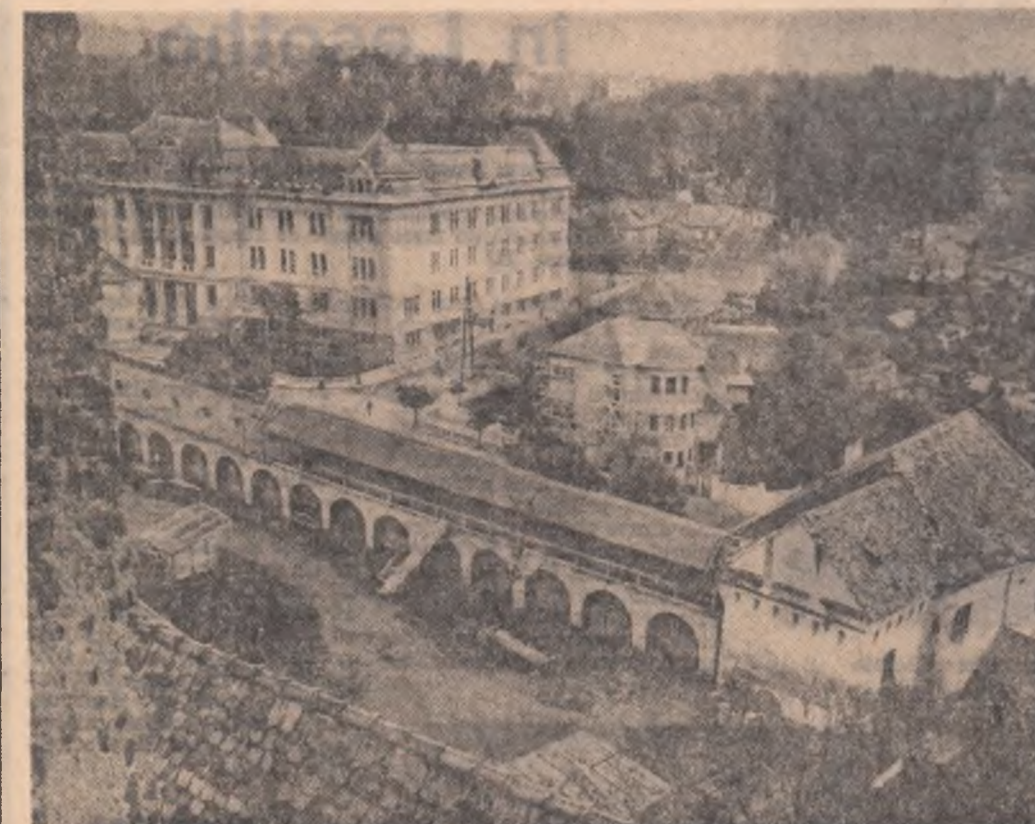
Se restaurează zonele vechii cetăți din Tg. Mureș.