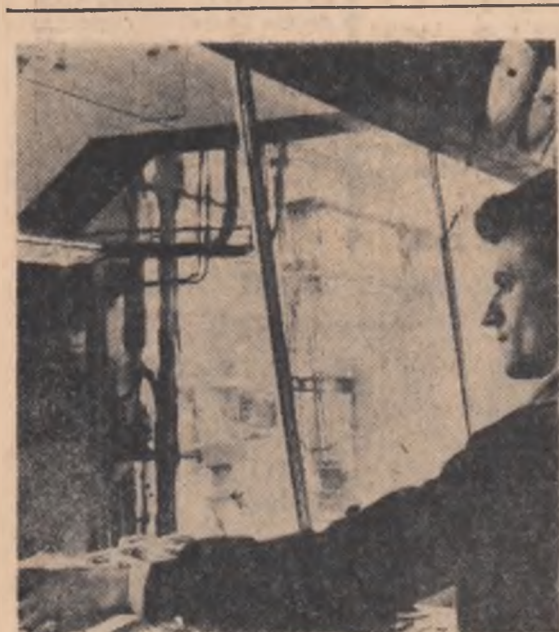
Combinatul siderurgic „Gheorghe Gheorghiu-Dej” din Galați. În cabina de comandă de la laminorul de tablă groasă

Uriașele agregate din lunca Sucevei, ce transformă lemnul pădurilor în suprafețe impresionante de hirtie nu s-au oprit nici o clipă. În prima zi a anului 1967, colectivul de muncă a înregistrat primele rezultate, cele dinții succese. Dispercerul de serviciu ne informează lapidar: în ziua de 1 ianuarie au fost realizate 141 tone celuloză și 187 tone hirtie, cu 12 tone mai mult decît cifra planificată.