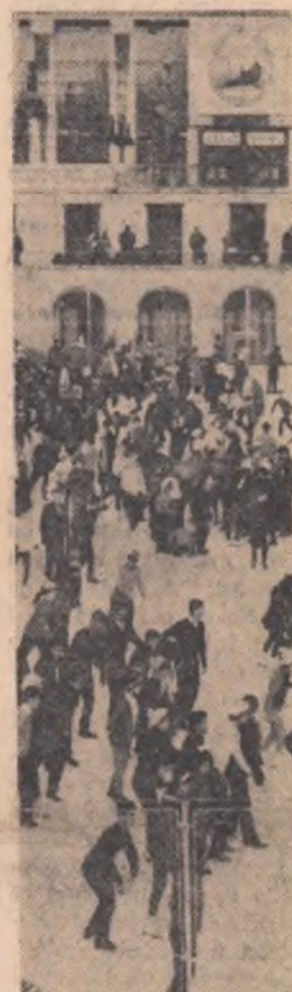
Animatie deosebită într-un loc de atracție, pentru tinerii din

Pe poarta Uzinei de tractoare din Brașov a ieșit cu destinația ogărele țării, tractorul cu numărul de fabricație 175 000. El reprezintă un important succes al constructorilor de mașini din Brașov, al industriei noastre. În anul cincinalului constructorilor de tractoare le va reveni sarcina sporirii, într-un ritm și mai dinamic, a producției anuale de tractoare și mai ales a diversificării producției lor. Astfel, în 1970 se vor produce aici nu mai puțin de 11 tipuri diferite de tractoare.