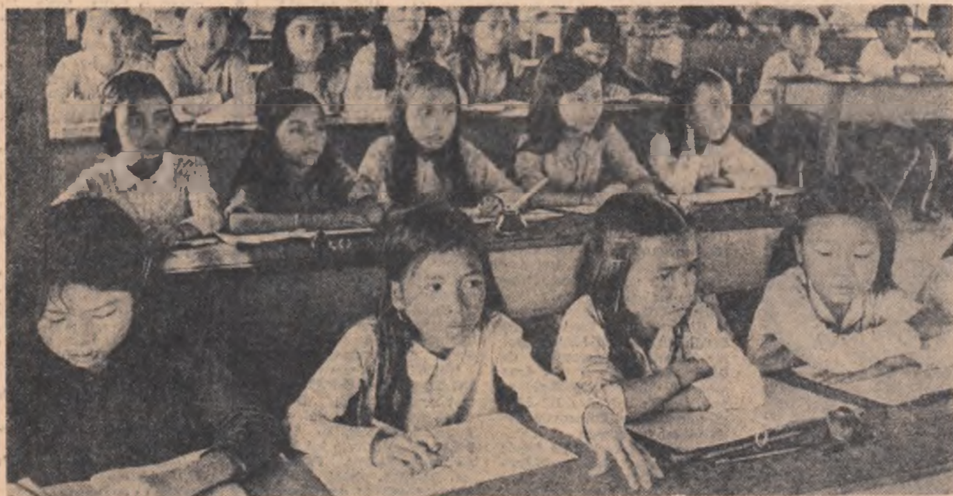
VIETNAMUL DE SUD. Oră de curs la una din numeroasele școli care funcționează în regiunile eliberate