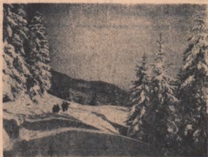
Invitație la drumetrie