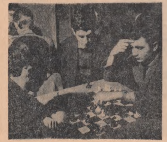
O partidă de şah este reconstruită şi în aceste zile premergătoare sesiunii examenelor studenţeşti. În fotografie un instantaneu de la Casa de cultură a studenţilor din Craiova