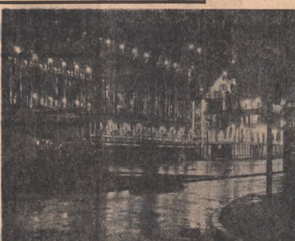
La Uzina chimică din Pitești, în cadrul probelor tehnologice, s-a produs pentru prima dată în țară negru de fum de înaltă abraziune. Iată un aspect nocturn al instalației cicloanelor-filtre.

C. M. Succint, eu aș spune că un seminar bun este acela de la care pleci cu un plus de inteligență, de cultură, înarmat cu mai multe cunoștințe despre viitoarea ta profesie și cu exemplificarea a un seminar de materialism dia-