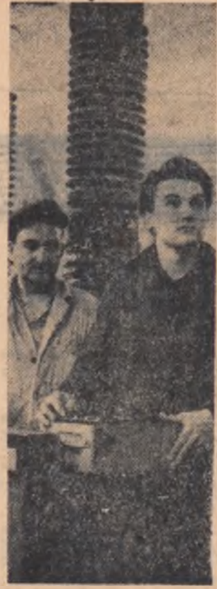
O probă de funcționare, un examen de calitate la un întreprinzător de înaltă tensiune produs la Uzina „Electroputere” — Craiova.