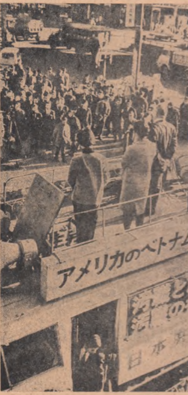
JAPONIA. — Aspect de la o adunare electorală care a avut loc la periferia orașului Tokio