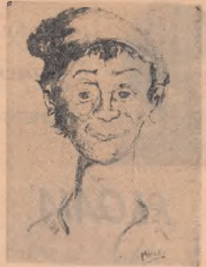
PĂCALĂ — desen de MIRCEA NISTORESCU, elev