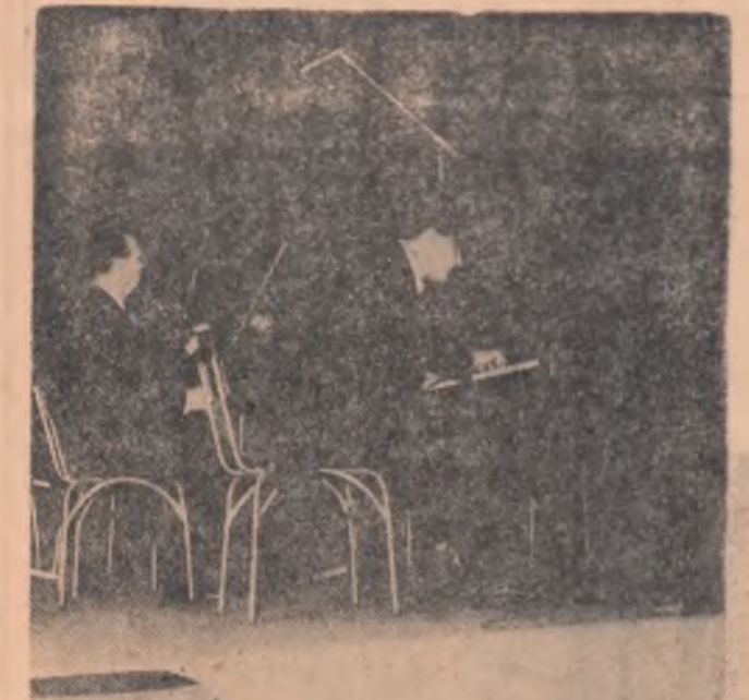
Radu Lupu interpretînd Concertul nr 3 de Beethoven

așteptat, Radu Lupu pătrunde spre izvoarele partiturilor, gîndurile sale îndreptîndu-se în primul rînd spre redarea