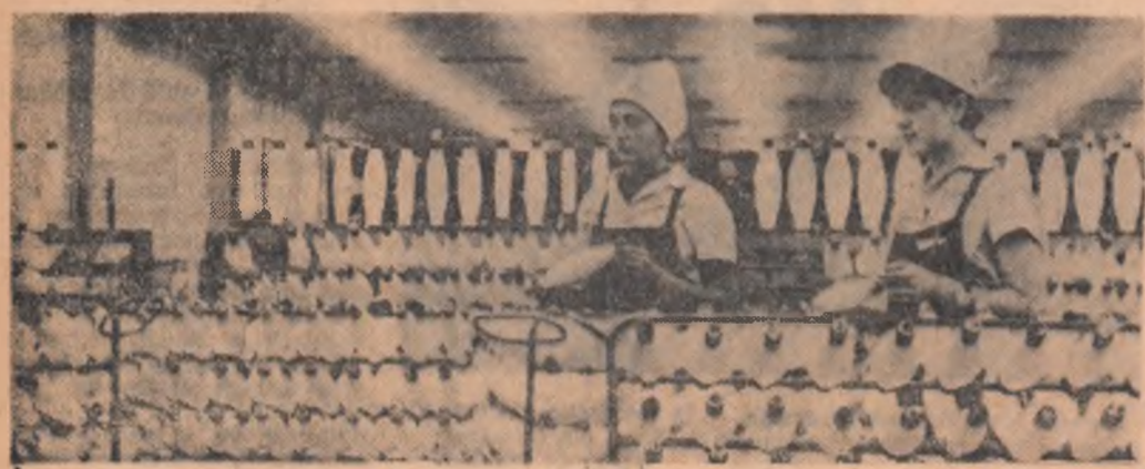
În atelierul de etirat fire al Uzinelor de fire și fibre sintetice Săvinești

Telepatia este un fenomen fără prea mare însemnătate în viața oamenilor, ea este însă de o mare actualitate științifică; telepatia a încetat să fie ceva senzațional, dar necesită cea mai competentă și serioasă analiză științifică.