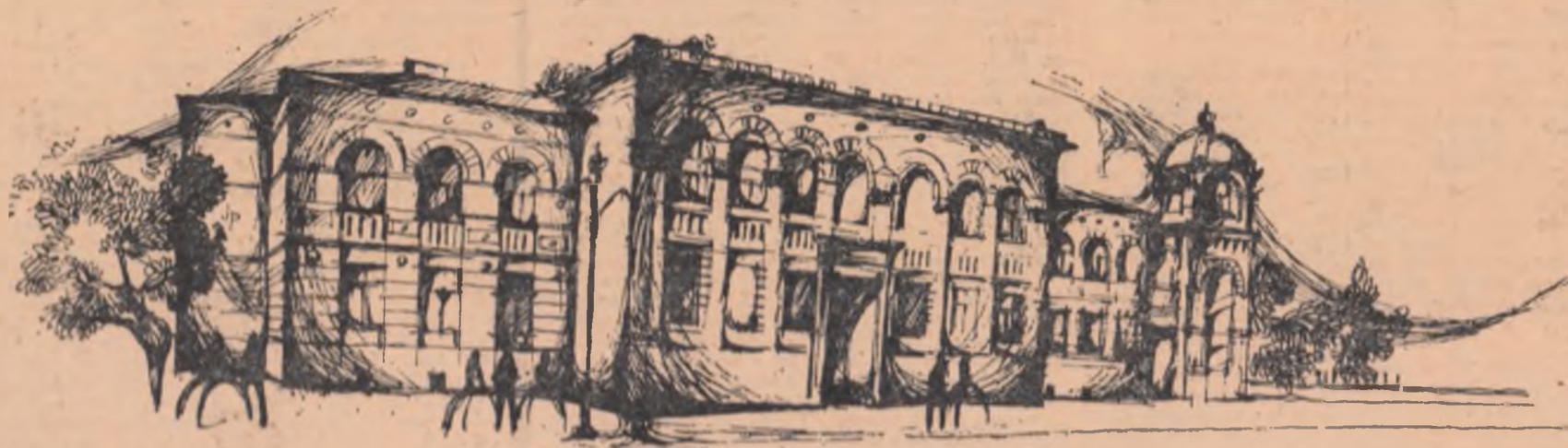
Liceul „Gheorghe Lazăr”. Desen de prof. GHERGHINA ZAHARIA

SUPLIMENT CULTURAL-ȘTIINȚIFIC AL „ȘCINTEII TINERETULUI” PENTRU ELEVI