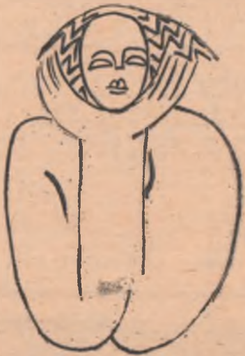
Desen de CRISTIAN PEPINO, elev

Pînă cînd am răgușit. Și m-am aplecat spre ploile de toamnă.