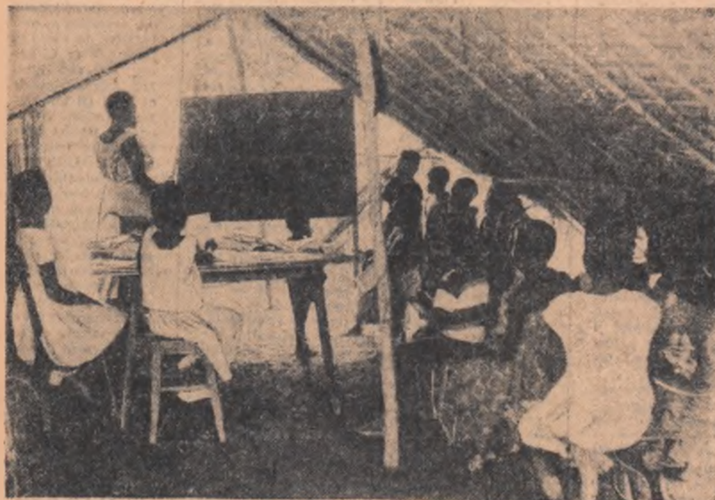
Undeva în spatele frontului: o școală deschisă într-o regiune din Angola pe care patrioții au eliberat-o