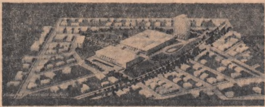
Macheta noului centru de televiziune București

La noua centrală telefonică din localitate a început montarea echipamentului pentru automatizarea legăturilor interurbane, intrarea în exploatare fiind prevăzută pentru sfîrșitul anului. Orice abonat din Brașov va putea obține astfel legătura cu orașul București sau cu localitățile de pe litoral, prin formarea de la domiciliu a numărului respectiv, fără intermediul operatorilor din centrală.