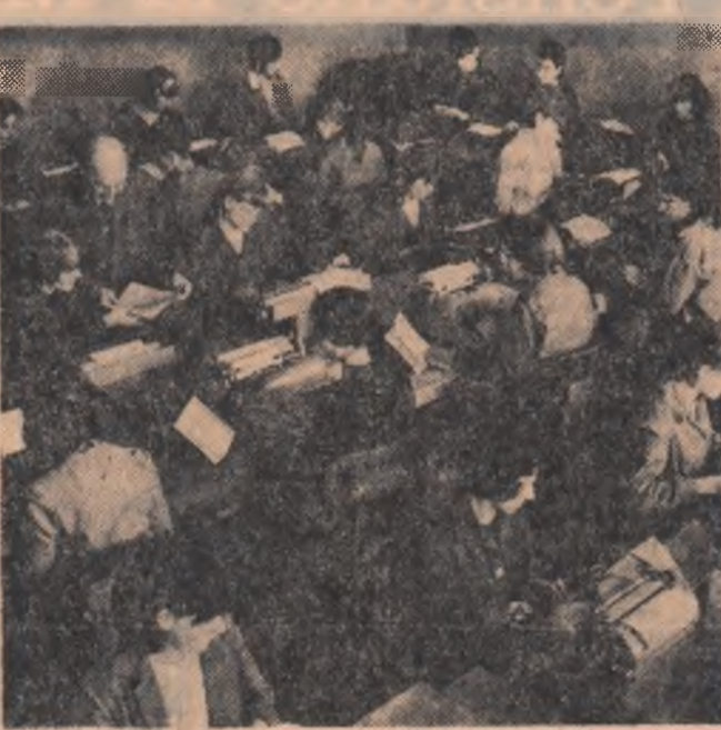
Oră de curs la Școala tehnică de stenografie