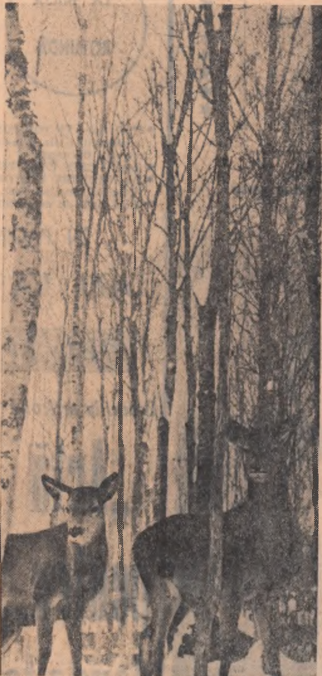
La marginea pădurii