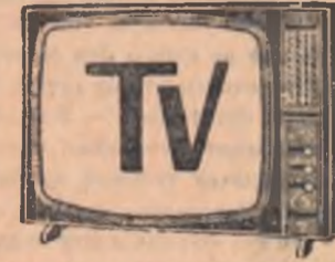
VINERI 3 FEBRUARIE

De aproape 2 luni funcțio- nează pe lângă Casa pionierilor din orașul Cîmpulung Muscel cercul „Pionierul ghid” inițiat de consiliul orășeneș al pionierilor. Dorința de a cu- noaște istoria orașului și mu- seelele lui dar mai ales de a dobîndi priceperea de a le dez- vălii grupurilor de elevi și pionieri care vizitează locali- tatea a adunat aici 50 de elevi care se pregătesc cu un deose- bit interes. Cursele se vor încheia în luna martie cu un concurs „Cine știe, răspunde”.