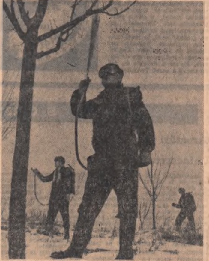
O lucrare de sezon care contribuie la combaterea dăunătorilor și, în final, la asigurarea unei producții mari de fructe: stropi- tul pomilor. În fotografie vă prezentăm un aspect de la electu- area acestor lucrări pe ultimele suprafețe ale cooperativei agricole din Valea Huștrăi, regiunea Oltenia

● Campionatul de fotbal al Americii de Sud a continuat cu desfășurarea meciului dintre e- chipile Paraguayului și Vene- zuelei. Fotbaliștii din Paraguay au câștigat cu scorul de 5-3 (4-2).