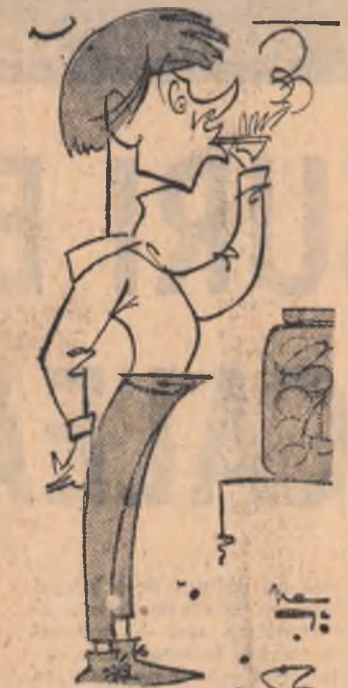
MIHAI IONIȚĂ (Spiridon)