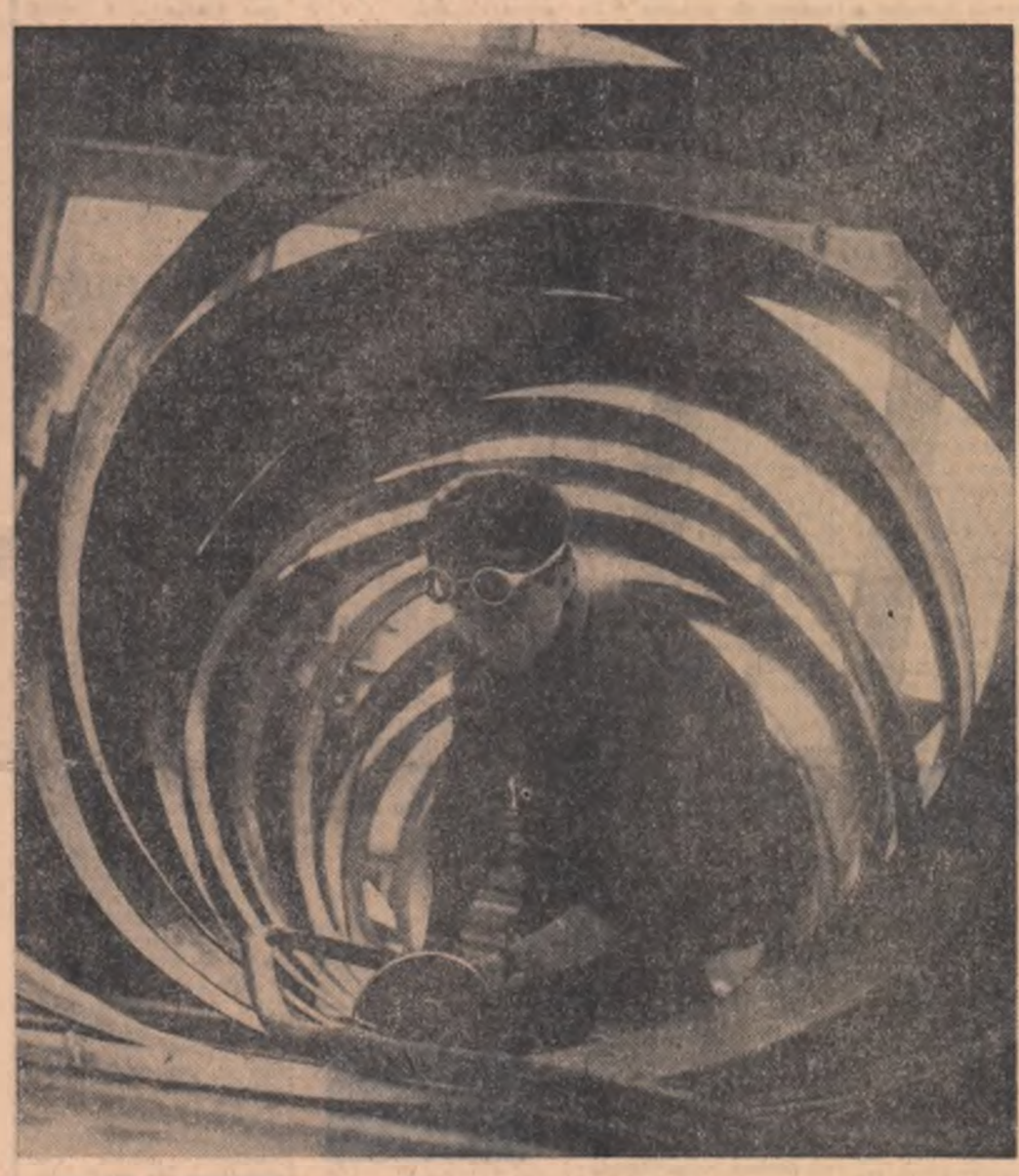
Geometrie Aspect de la Uzina mecanică Timișoara

Într-un număr viitor PRIMUL SUPLIMENT ȘTIINȚIFIC al