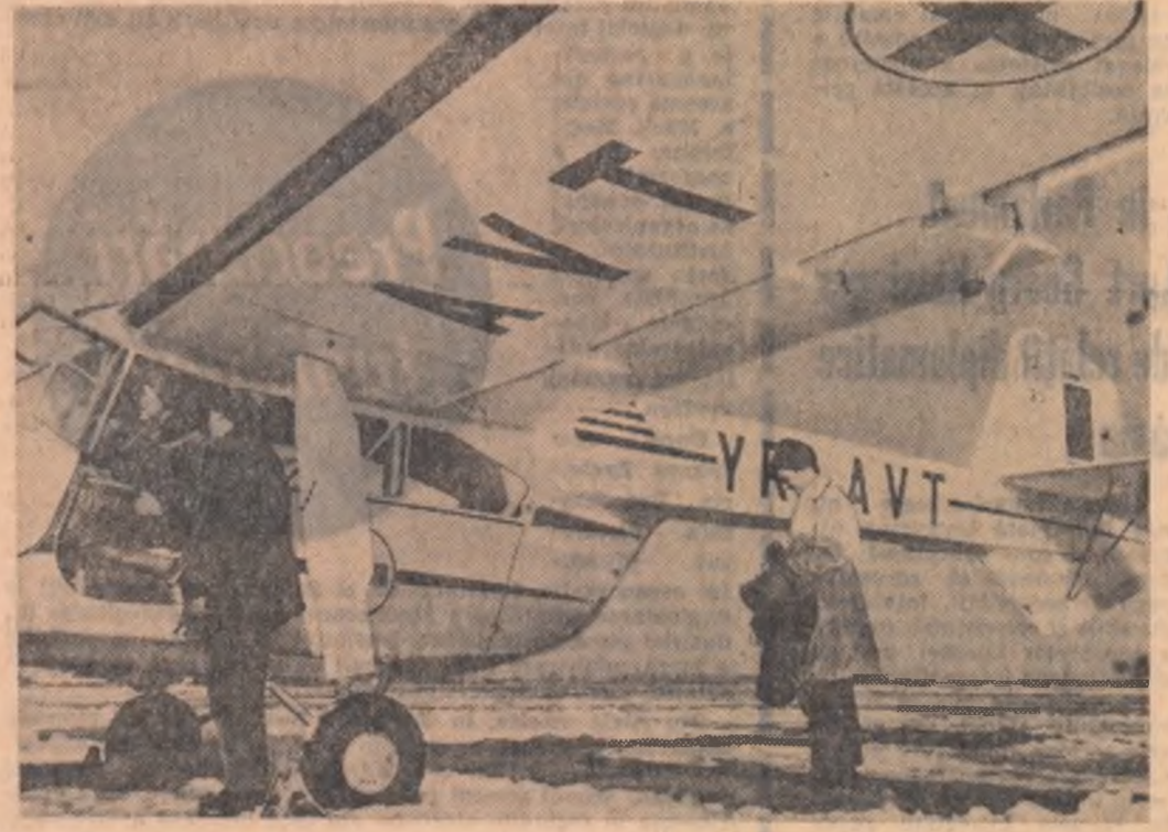
Pregătiri pentru o nouă misiune