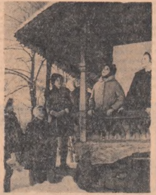
Muzeul satului din București, mijloc de cunoaștere pentru mari și mici

pantofii și cărțile de școală. Și băieții au crescut. Obișnuți să se așeze la masă la ora fixă, să nu întîrzie seara peste ora 9, să nu facă în casă gălăgie — „tata doarme” MARIETA VIDRAȘCU (Continuare în pag. a III-a)