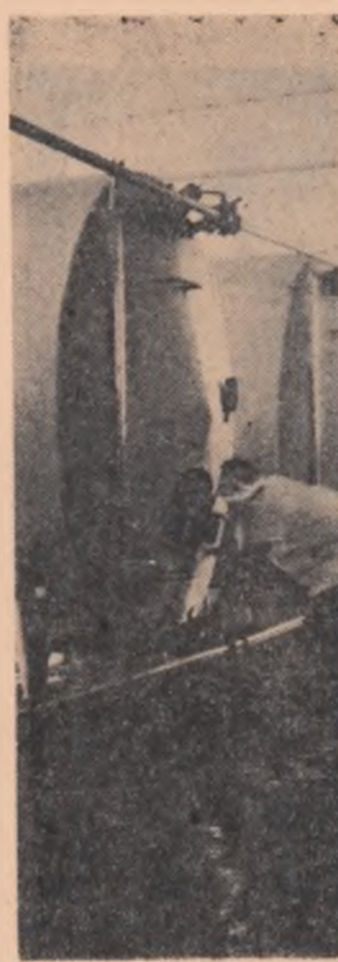
R. P. BULGARIE. — Imagine surprinsă la Fabrica de produse lactate din Sofia

Boabele transformate într-un lichid aromat ce, pară a împrumutat culoarea pielii africanilor, au pătruns pretutindeni pe planeta noastră. Unii decretază cafeaua drept un reconfortant, iar alții o denunță ca un dușman al sănătății, dar sute de milioane de oameni de pe toate continentele o consumă cotidian cu o perseverență ce ignorază avertismentele. Consumatorii de cafea se gîndesc rareori la destinul boabelor cafelei, la zburcucimii celor ce muncesc pentru a le stringe, la speranțele lor care se destramă după fiecare recoltă. O știre de numai cîteva rînduri, săraca în amănunte, ne-a parvenit din Londra. După trei săptămîni de dezbateri, Comitetul executiv al Organizației internaționale a cafelei a decis ca două milioane de saci de cafea să fie retrași de pe piață începînd cu prima zi a lui aprilie. Scopul: stabilizarea prețurilor în circuitul mondial al cafelei. Miliarde de boabe — miliarde de boabe — miliarde de porții de cafea și-au