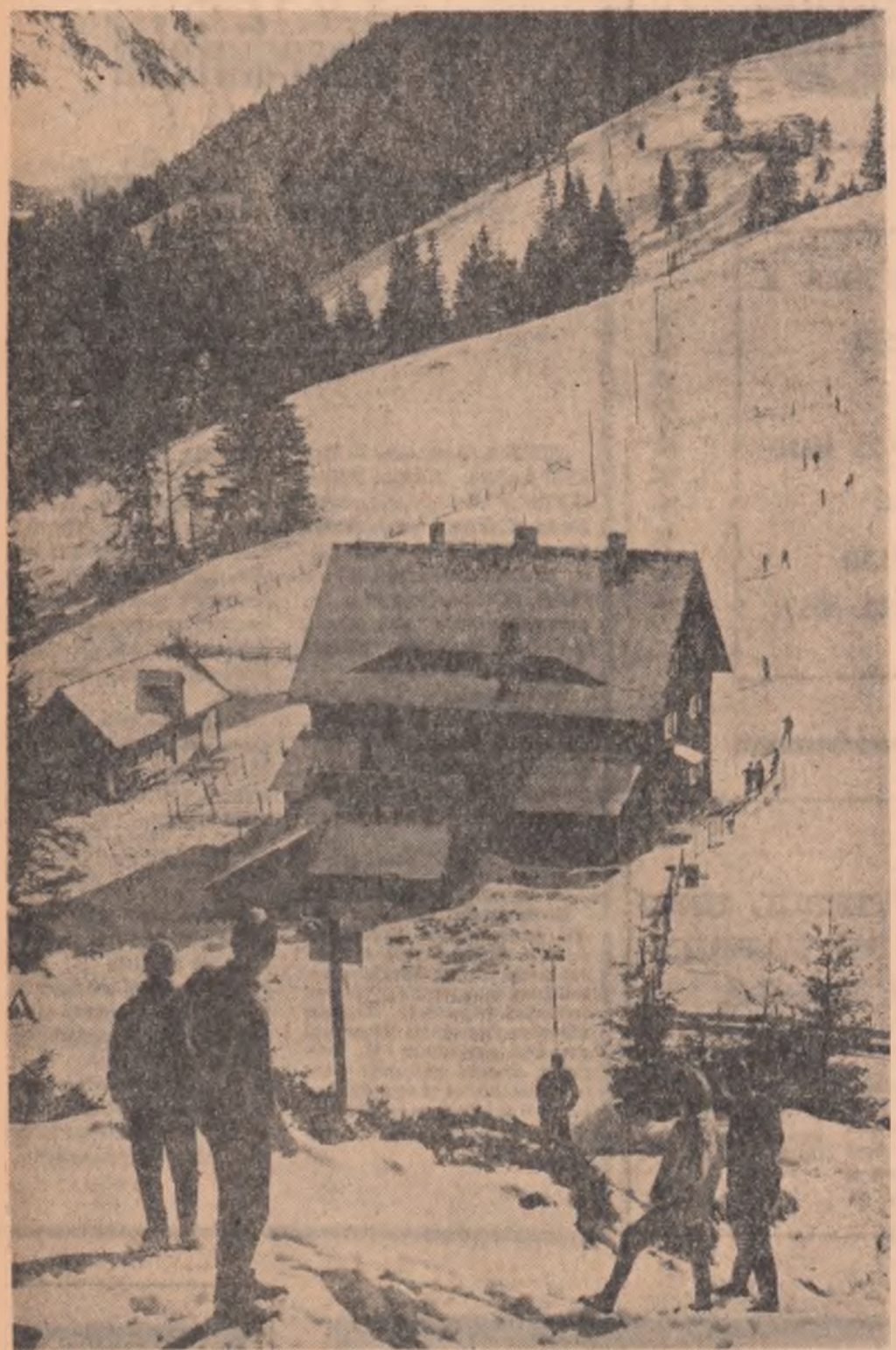
La cabana Dtham