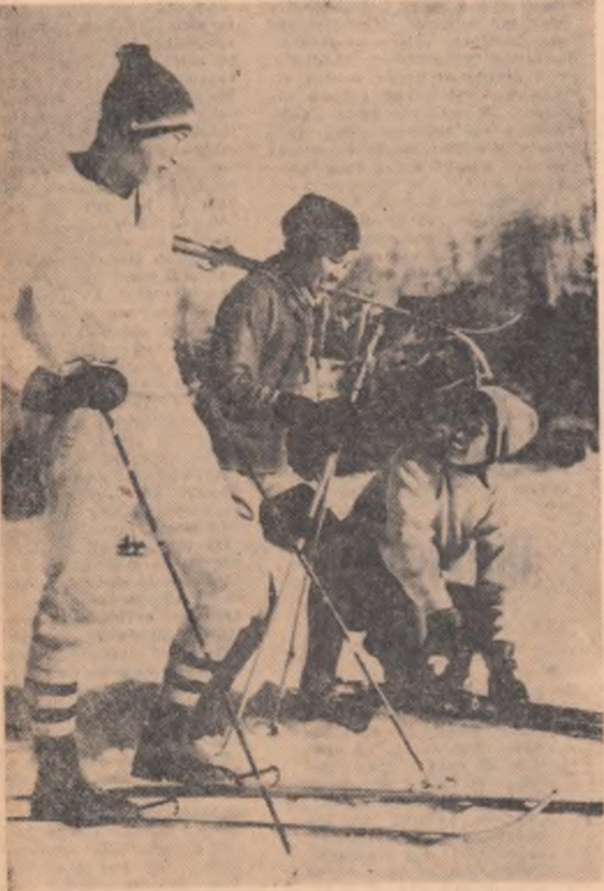
R. P. D. COREEANĂ. — Tineri schiori la Samjiyun

Purtătorul de cuvânt a explicat că această „diferență” provine din faptul că pînă acum nu au fost socotite avioanele pierdute în urma atacurilor împotriva aeroporturilor americane din Vietnamul de sud și a accidentelor. Potrivit agenției Reuter, aceleași surse au indicat că unul din motivele pentru care nu au fost dezvăluite amănunte privitoare la toate pierderile de avioane, a fost acela „ca inamicul să nu ia cunoștință de proporțiile pierderilor suferite de aviația americană”.