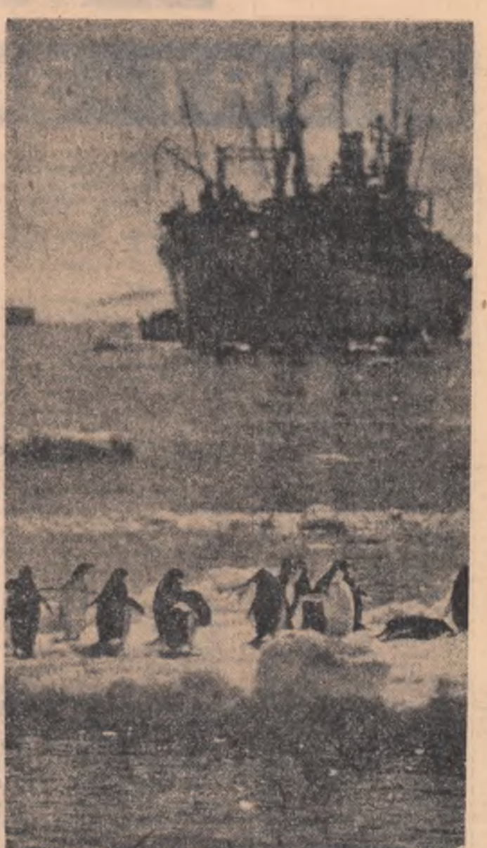
CHILE. — Imagine din Țara de Foc

DUPĂ cum relatează agenția Press Trust of India în timp ce rostea un discurs în cadrul mitingului electoral desfășurat miercuri în orașul Bhubaneshwar, capitala statului indian Orissa, primul ministru, Indira Gandhi, a fost victima unui act huliganic, fiind lovită cu o piatră în obraz. Nemaiputîndu-și continua cuvîntarea, ea a fost transportată de urgență la reședința guvernatorului statului, unde i s-a acordat primul ajutor. Starea sănătății sale nu prezintă nici un motiv de îngrijorare. Mai mulți tineri din grupul huliganilor au fost arestați.