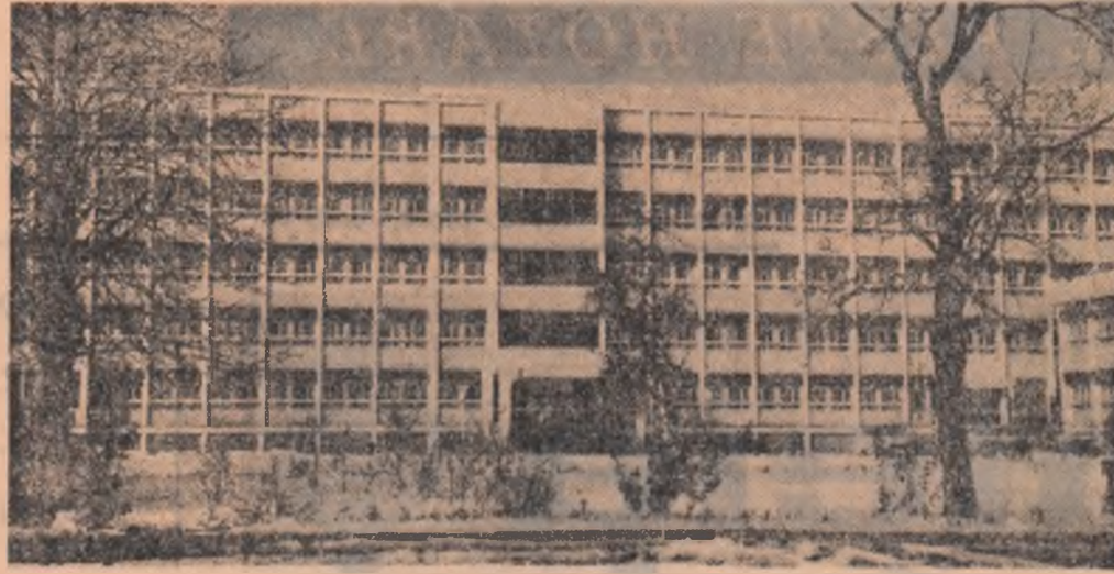
Maternitatea din Bacău

Există un destin ca pe scenă actorul să fie acela care joacă piesa și nu autorul, regizorul sau scenograful. Dincolo de malitia evidentă, actorul (sau mai exact spus distribuția), este în acest caz acela care comunică spectatorului intențiile acestei trinități, susține marea confruntare cu publicul.