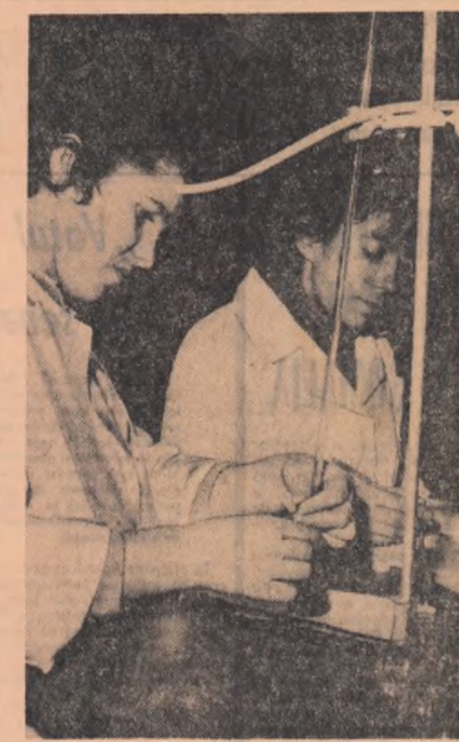
Intr-unul din laboratoarele Institutului de cercetări pentru cultura cerealelor şi plantelor tehnice Fundulea

(În repetate rînduri, cuvîntarea tovarăşului Nicolae Ceauşescu a fost subliniată de aplauzele vii, puternice, ale asistenţei)