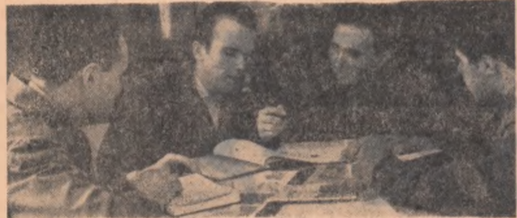
Împreună cu interlocutori ai anchetei noastre la Uzina de mașini electrice

Deschizând, în urmă cu citva timp, coloanele ziarului unei largi anchete care să ducă la definirea profilului social-moral al tinerei noastre generații, am primit la redacție sute de scrisori de tineri din cele mai diferite sectoare de activitate. Răspunsurile au în nota lor esențială un consens unanim: a fi tânăr înseamnă a munci. Propoziția aceasta cu acoperirea totală a unei lapidare definiții este cel mai generos reper al raportării noastre permanente. „A fi tânăr înseamnă a munci — aceasta e convingerea mea și a generației mele” — ne scrie unul dintre corespondenții noștri.