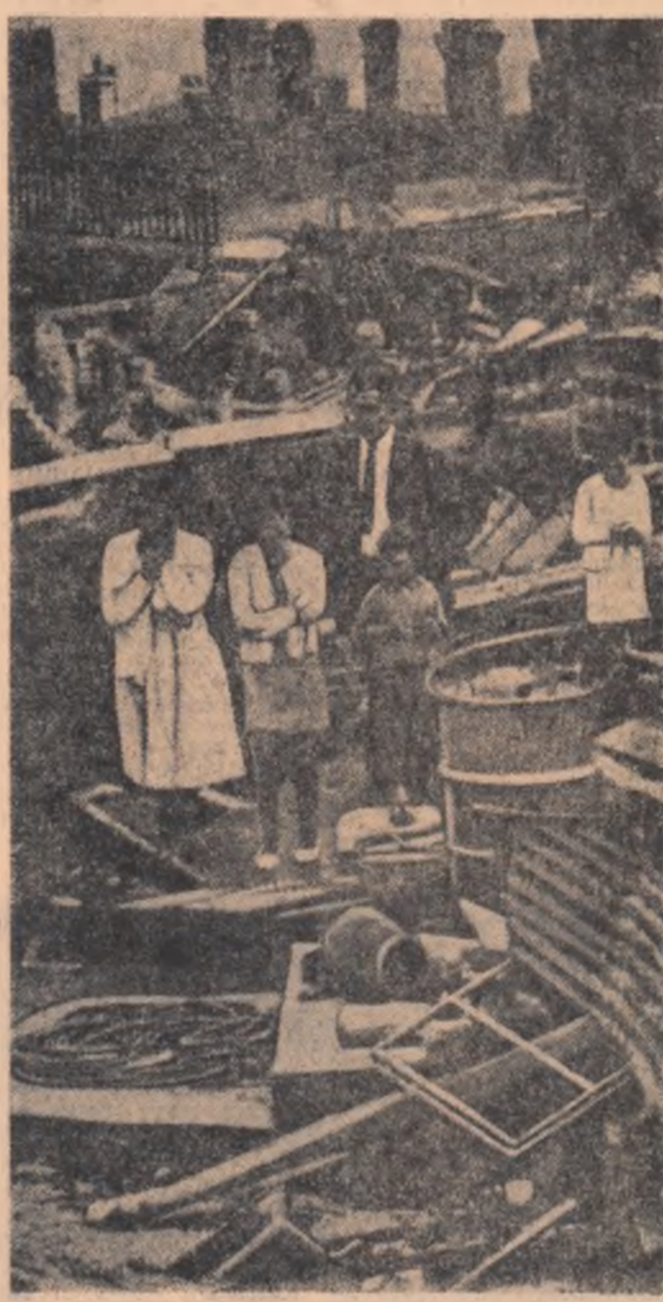
Una din numeroasele familii rămase fără adăpost în urma incendiului care a distrus suburbiile din Hohoth — Tasmania

În problema aderării Angliei la Piața comună, arată cercurile guvernamentale, guvernul federal va căuta să fie „purător de cuvînt rezonabil și obiectiv” în cadrul consultărilor sale cu Anglia avînd grijă să evite o prejudiciere a relațiilor franco-vest-germane. De aceea, adaugă aceste cercuri, „ar fi greșit ca Anglia să fie lăsată să-și facă prea multe speranțe în această problemă”. În ce privește problema compensațiilor în devize pentru staționarea trupelor britanice de pe Rin, aceleași cercuri au declarat că pentru aceste trupe s-a creat „o situație excepțional de grea”, iar guvernul federal nu va fi probabil în măsură să-și ia angajamente de viitor față de premierul britanic. Dificultățile ar consta, în primul rînd, în faptul că balanța de plăți anglo-vest-germană este deficitară, astfel încît acest lucru ar îngrădi noi achiziții vest-germane de armament din Anglia. Mai mult, la Bonn se consideră drept îndoielnic că guvernul federal va putea să-și mențină oferta inițială de a plăti Angliei anual devize în vuloare de 350 milioane mărci. Lărgită prin aceste probleme în care nu există încă puncte de vedere comune între cele două părți, misiunea diplomatică a premierului britanic se anunță a fi dificilă.