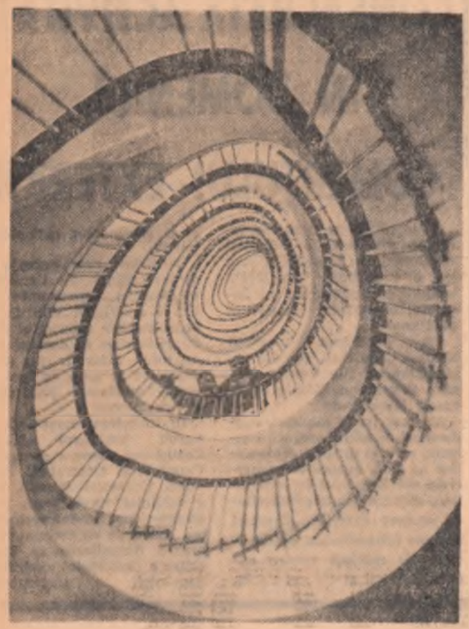
Detaliu arhitectonic la unul din noile blocuri turn din cartierul Nicolina — Iași

Inarmați cu biletul de carton portocaliu ne îndreptăm spre autobuzul de Rm. Vilcea. A început să ningă cu fulgi mari. — Tovarășe sofer! Unde punem bagajele? — În mașină. N-am prelată. Nu puneți valizele în plasă — se aude glasul autoritar al conducătorului autobuzului. Ca la o comandă valizele și sacii ocupă culoarul de trecere dintre scaune. Acum chiar că nu te mai poți mișca.