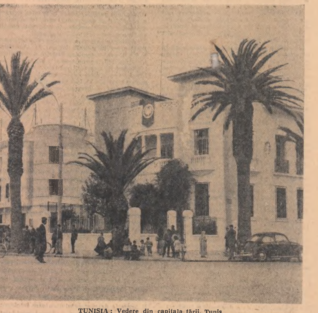
TUNISIA: Vedere din capitala țării, Tunis