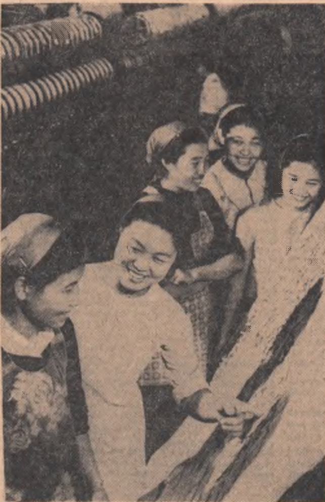
R. P. D. COREEANĂ. Tinere muncitoare de la fabrica de mătase Chullima din Phenian

repercusiuni asupra economiei Irakului, dependentă în mare măsură, de veniturile pe care le aduce petrolul. Irakul însă, a spus Najî Taleb, dispune de bogate resurse naturale și dacă acestea ar fi mai bine exploatare, „întreruperea traficului petrolului n-ar mai constitui o problemă”. Totodată, premierul irakian a adăugat că guvernul a hotărît crearea unui înalt Consiliu care va controla activitatea de valorificare a altor resurse irakiene.