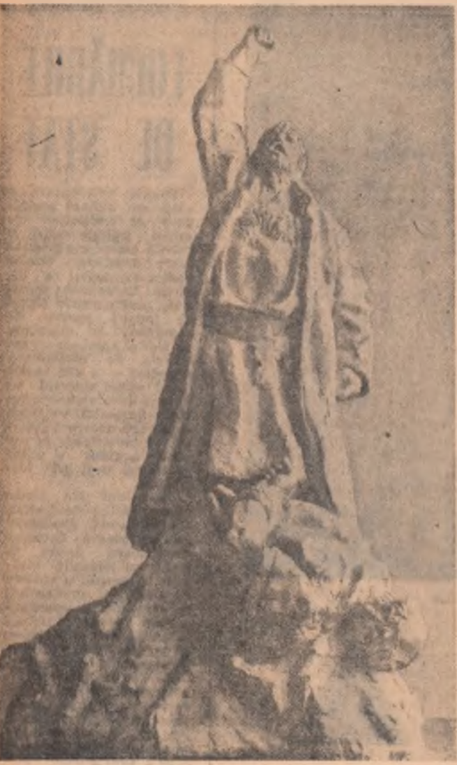
NAUM GORGESCU 1907