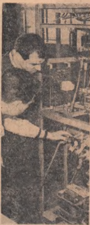
La uzinele „Electromagnetica” din Capitală se fabrică redresoare, care vor fi folosiți la noile centrale automate produse aici. În fotografie aspecte de la montaj