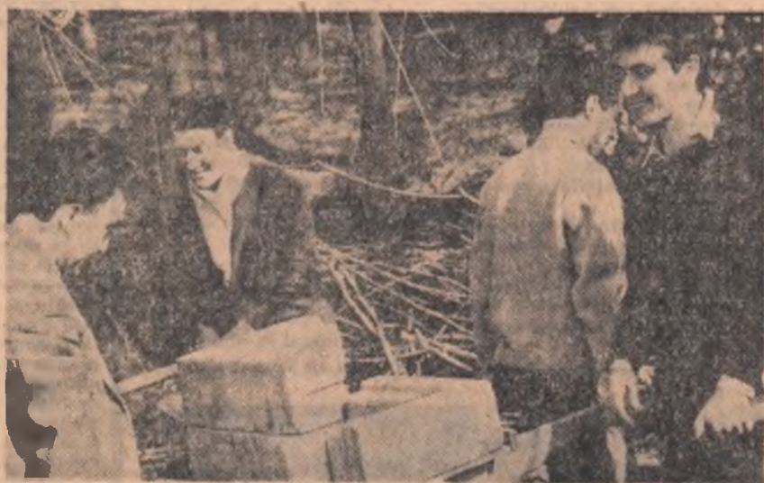
Nimic nu ne pare prea greu !..

— Sîntem mai mult decât mulțumiți de ceea ce au făcut astăzi, tinerii. Și încă un fapt: „ziua de muncă” aici la baza