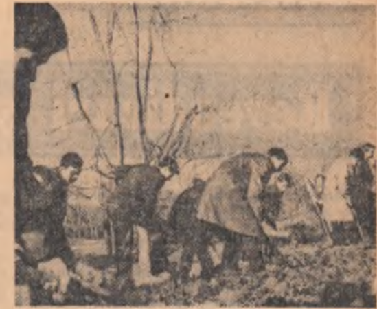
Tinerete, primăvară și încă ceva...

Toate aceste obiective au de-acum un caracter permanent. Organizația U.T.C. din Capitală numără peste 191 000 de tineri care doresc să participe cu înflecție la acțiunile de muncă patriotică. Avem, de asemenea, toate posibilitățile, tot sprijinul, ca această acțiune să fie cit mai bine organizată. Ceea ce își propune comitetul orașeneș U.T.C. este să le folosească cît mai judicios, mai chibzuit, străduindu-se să confere acțiunilor de muncă patriotică atît continuitate cît și caracterul educativ necesar.