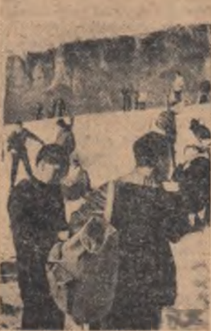
Popas pe Clăbucet

Adăugate celor 975 de apartamente și școlii cu 16 săli de clasă construite în anii trecuți, acestea vor conferi tinărului oraș o nouă dimensiune și frumusețe.