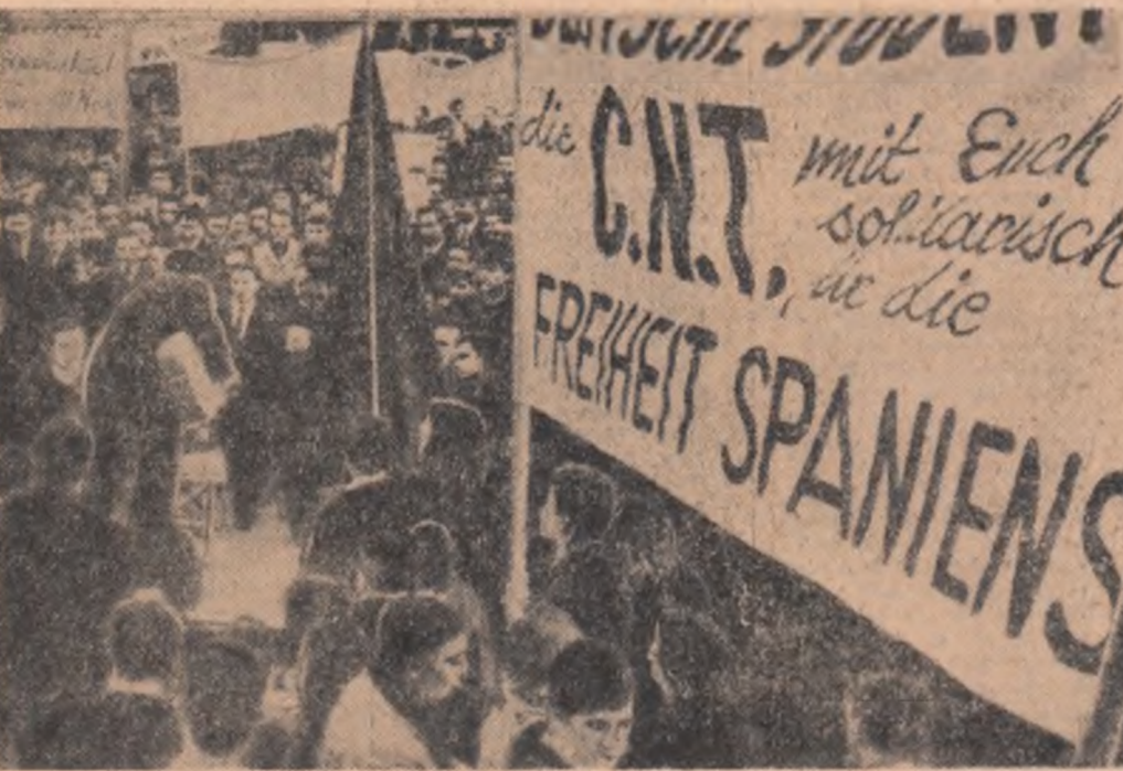
Imagine de la mitingul de solidaritate al studenților vest-germani din Frankfurt, cu acțiunile revendicative ale studenților spanioli.