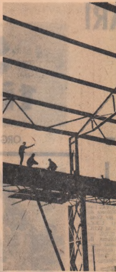
Se conturează viitoarele hale