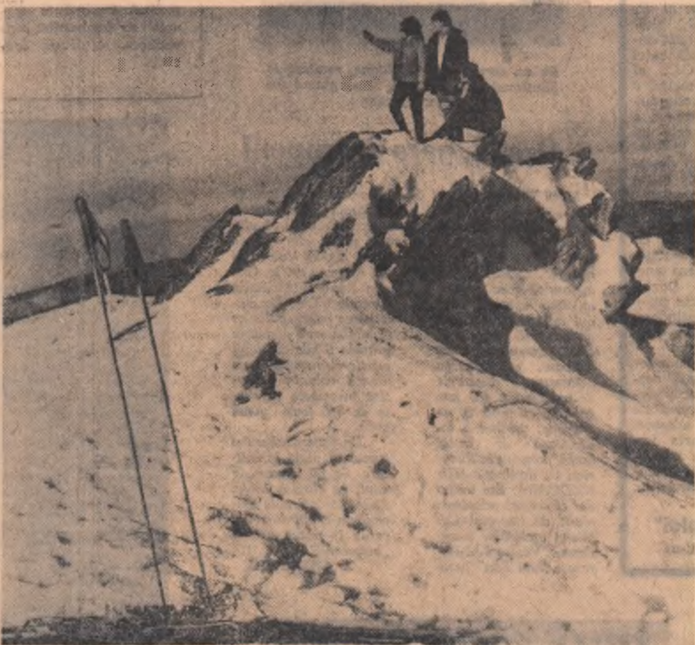
Bună dimineața munte!