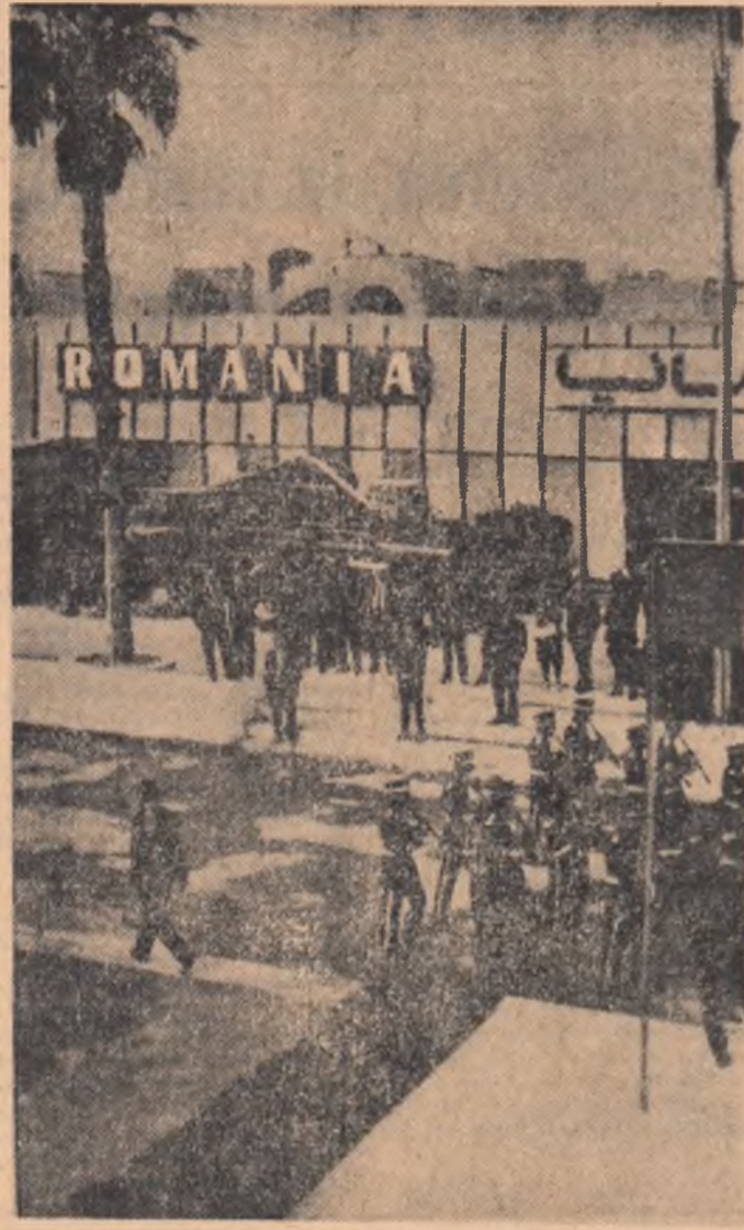
Vedere exterioră a pavilionului României la Tîrgul internațional de la Tripoli