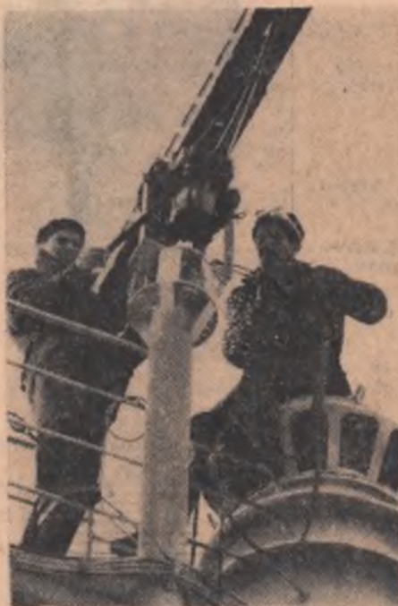
Pe un cargou de 4.500 tone, realizat la Șantierul Naval Galați, se montează instalația radar

ANUL XXIII SERIA II NR. 5537 5537 6 PAGINI 25 BANI — JOI 9 MARTIE 1967