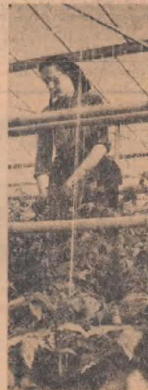
Sub urțașă cupolă de sticlă a serei, roșile au rodit, iar în curînd vor lua drumul pieșt

BADUTA CONSTANTIN Correspondent voluntar