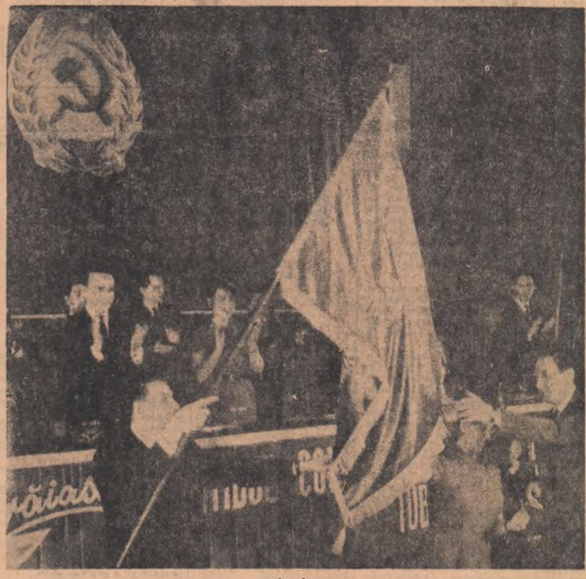
Momentul mult așteptat