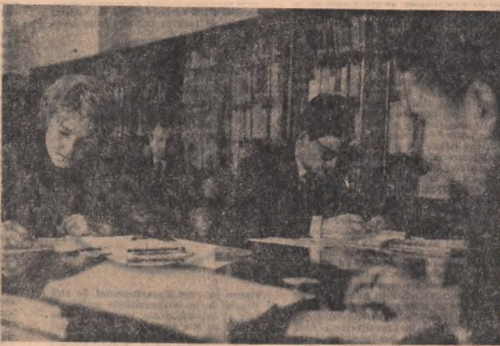
În sala de lectură a bibliotecii universitare din Capitală

— Rică Venturiano! L-am pregătit în anii studenției cu Victor Ion Popa. Dar nu l-am lăsat niciodată în fața publicului... Nu „feti” actorii vor să joace Hamlet”. Nu