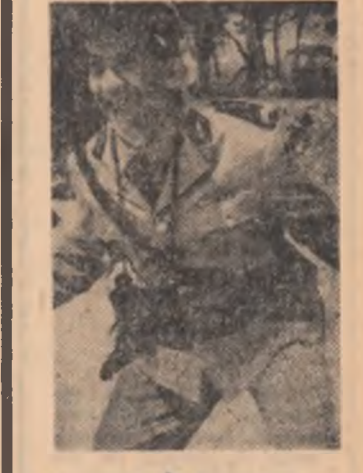
Bouts de Funés în „Jandarmii din Saint-Tropes”

EE GRECO - cinematocop rulează la București (orele 15,30; 18; 20,30); FANTOMA DIN MORRISVILLE rulează la București (orele 9,30; 11,45; 14,15; 16,30; 18,45); MONDO CANE (ambele seri) rulează la Unirea (orele 15,30; 19); DIMINETILE UNUI BĂIAT CUMINTE rulează la Vitan (orele 15,30; 18; 20,15); ÎNAINTA DE RĂZBOI rulează la Miorița (orele 10; 12; 14,15; 16,15; 18,30; 20,30); UN MARTOR ÎN ORAȘ rulează la Munca (orele 16; 18,15; 20,30); NU SÎNT DEMN DE TINE rulează la Popular (orele 15,30; 18; 20,30); NOTRE-DAME DE PARIS — rulează la Flacăra (orele 15,30; 18; 20,30); INSPECTORUL DE POLIȚIE rulează la Moșilor (orele 15; 17; 19; 20,45); CARTEA DE LA SAN MICHELE rulează la Colentina (orele 15,40; 17,45; 20); OGINDA CU DOUA FETE rulează la Rahova (orele 15,30; 18; 20,30); Volga (orele 9,30; 11,45; 14,15; 16,30; 18,45); RIDEM CU STAN ȘI BRAN rulează la Progressul (orele 10; 15,30; 18; 20,30); NEVISTE PERICULOASE rulează la Lira (orele 15,30; 18; 20,30).