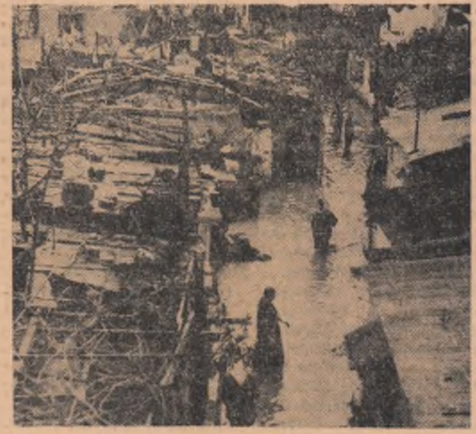
Imagine din timpul inundațiilor care s-au abătut recent asupra orașului Beyrut

Reprezentanții S.U.A., Canadei și Italiei la O.N.U., au propus un proiect privind crearea unui „consiliu al Națiunilor Unite pentru Africa de sud-vest”. Potrivit proiectului, care va fi supus Adunării Generale a O.N.U., acest consiliu va fi compus dintr-un reprezentant special numit de secretarul general al O.N.U. și din trei sau patru membri care vor fi desemnați de către președintele Adunării Generale. Consiliul va fi mandatat în vederea „unui studiu aprofundat asupra situației din Africa de sud-vest”, în baza căruia să fie hotărâte „măsurile ce vor fi întreprinse în vederea creării unui guvern autonom”. Același consiliu va trebui să studieze condițiile în care Africa de sud-vest va urma să-și cucerească independența.