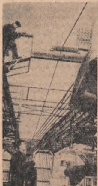
Uzinele „1 Mai” Ploiești. Platoul general de asamblaj al instalațiilor de foraj. Aici se fac probele tehnologice ale unei noi instalații.

Am mai putea aminti de asemenea sute de cazuri în care doctorii și personalul mediu al spitalului nr. 2 din Timișoara stau de strajă sănătății oamenilor. Se poate însă întotdeauna vorbi în același mod despre opera de asistență medicală desfășurată la acest spital?