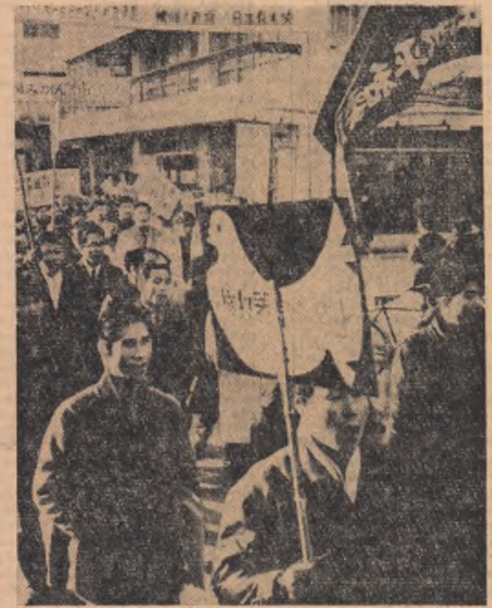
JAPONIA. Recent la Tokio, cu prilejul comemorării victimelor experienței americane din Arhipelagul Bikini, a avut loc o manifestație