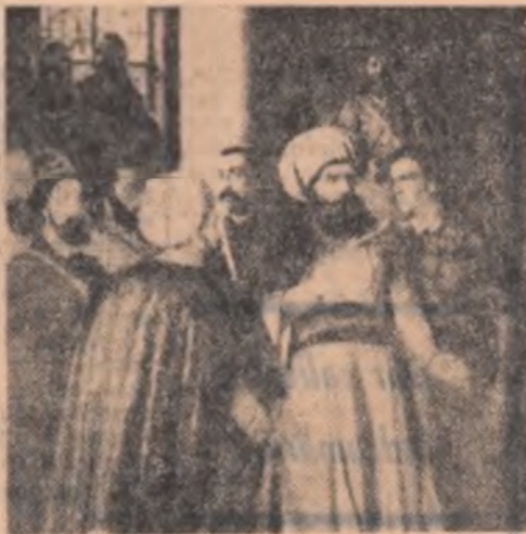
THEODOR AMAN: „Vlad Tepeș și solii turci” (detaliu)