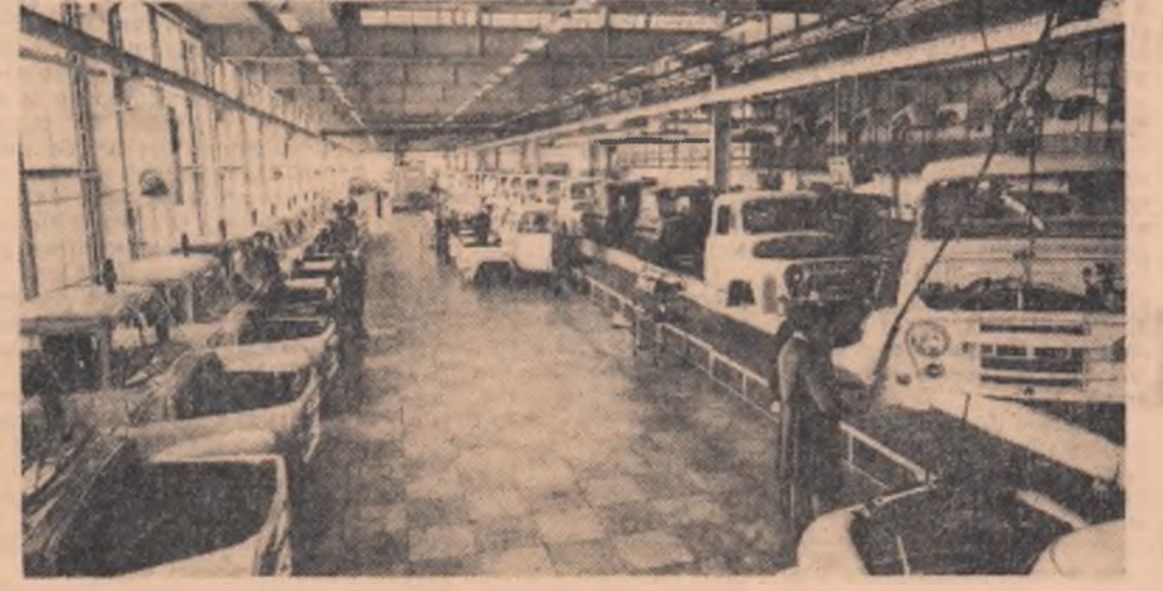
Aspect din moderna hală de montaj a Uzinelor „Steagul roșu” din Brașov

V. ARACHELIAN (Continuare în pag. a V-a)